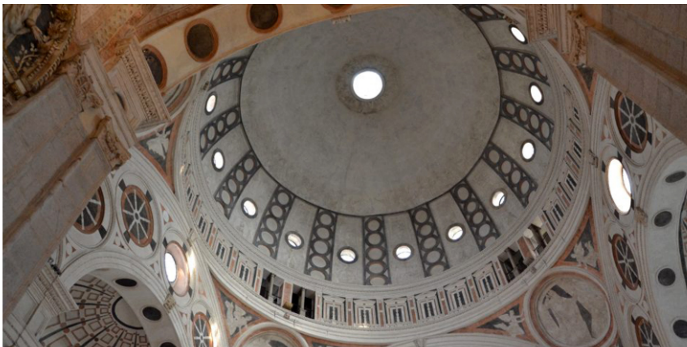
Kościół Santa Maria delle Grazie.

które dzięki temu nie konkurują pomiędzy sobą. Ukrzyżowanie Donato Montorfano, tak interesujące, nasycone całym szeregiem właściwie samodzielnych przedstawień, rozgrywających się w jego poszczególnych partiach, pełne wielobarwnie ubranych postaci z epoki, ciekawie skomponowanego pejzażu i umieszczonej w nim architektury, przegrywa (chyba najbardziej przez sam fakt obecności w refektarzu) z Ostatnią Wieczerzą . To ona, jej magiczna siła, jej Mistrz i twórca, Leonardo da Vinci, są powodami, dla których, po raz kolejny odwracamy się plecami do Ukrzyżowania , by jeszcze raz, z bliska i z daleka, obserwować i kontemplować atmosferę ostatniego, przed Ukrzyżowaniem, spotkania Chrystusa ze swoimi uczniami.