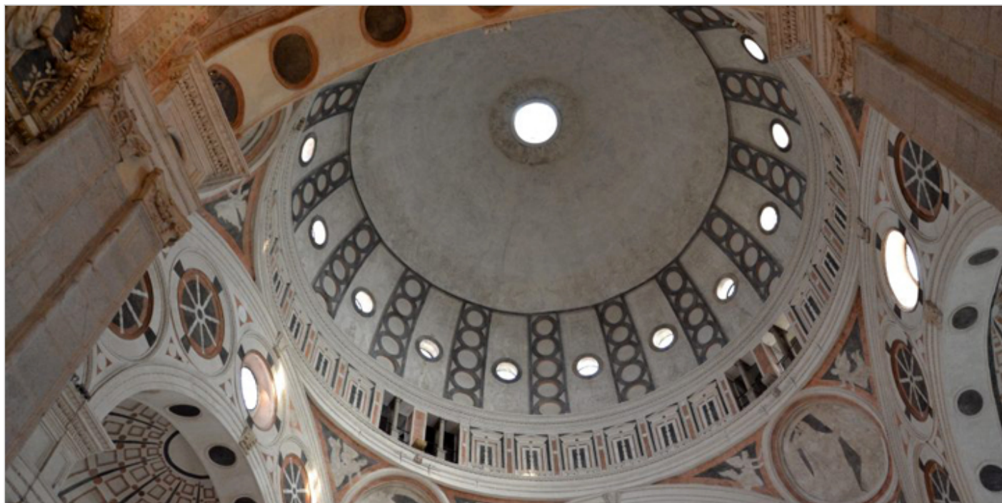
Kościół Santa Maria delle Grazie.

W refektarzu panuje cisza, nie słychać nawet dźwięków elektronicznych aparatów fotograficznych japońskich turystów. Tutaj fotografii robić nie wolno. Z tej magicznej ciszy usłyszeć można, wydobywające się - i to wyraźnie - głosy apostolskich rozmów, szelest szat ocierających się o białe nakrycie długiego stołu postawionego w poprzek wielkiej renesansowej, reprezentacyjnej komnaty. Trwa dyskusja, pełna dziwnego niepokoju. Nie słychać jeszcze trzasku łamanego chleba, nikt jeszcze nie podniósł kielicha z winem. To nastąpi za chwilę. Wracam po raz kolejny tuż pod barierkę oddzielającą malowidło od widzów. Padające na malowidło, przefiltrowane światło, wydobywa z niego wszystkie, dotąd ukryte pod brudem, niuanse bogatej palety barwnej. Za plecami Chrystusa, w okiennych