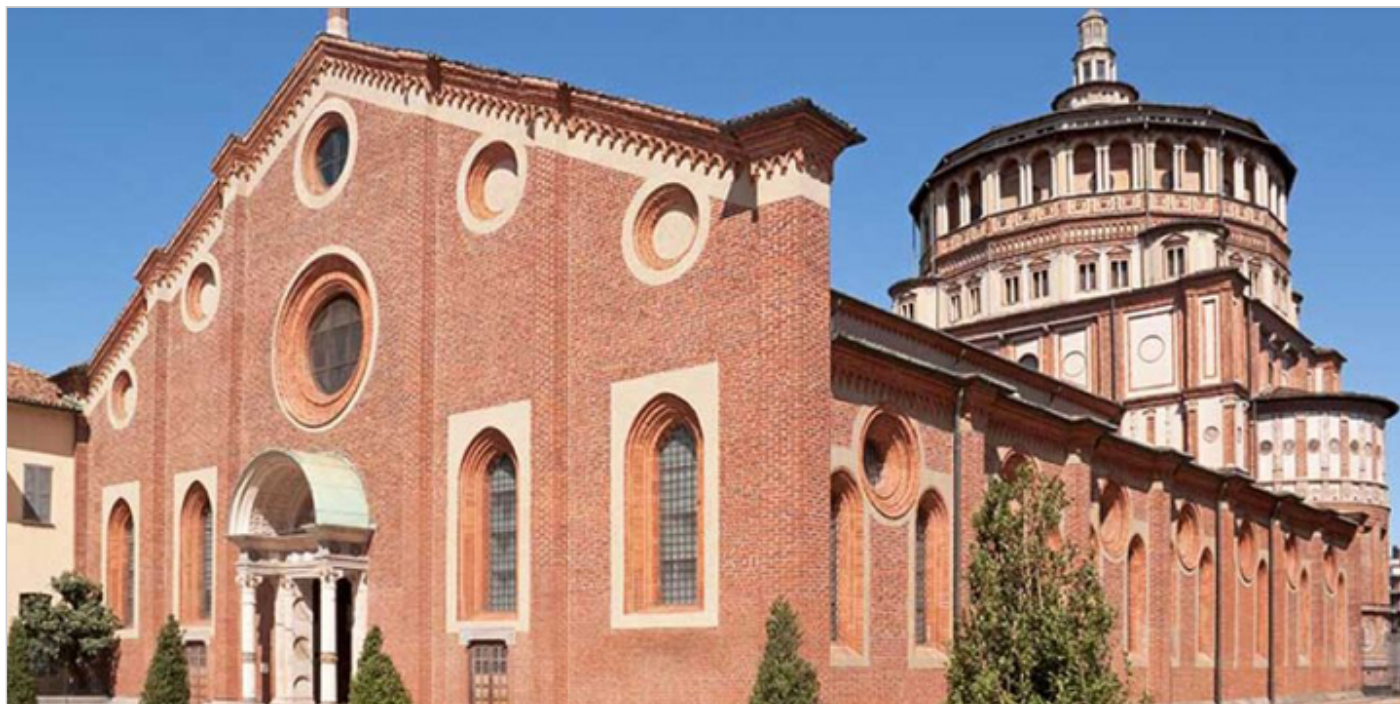
Kościół Santa Maria delle Grazie.

Ten, kto widział arcydzieło Leonarda przed laty, kiedy czekało jeszcze na swoją konserwację, bez wątpienia zastanie obecnie dzieło inne, niż to, które zarejestrował w swojej pamięci, a które to w wielu miejscach i w różny sposób powielane i reprodukowane, przewijało się w życiu prawie każdego z nas. Spod grubych nawarstwień brudu oraz wszelkich materiałów malarskich, nanoszonych na malowidło podczas wielu wcześniejszych, zabezpieczających je zabiegów, cała jego powierzchnia, poza partiami które uległy nieodwracalnej destrukcji, odzyskała swój pierwotny, oryginalny wygląd. Przywrócenie blasku bogatej paletce barwnej kompozycji oraz oryginalnych cech jej rysunku, następowało na przestrzeni dwudziestu lat w sposób laboratoryjny, i jak podają opisy