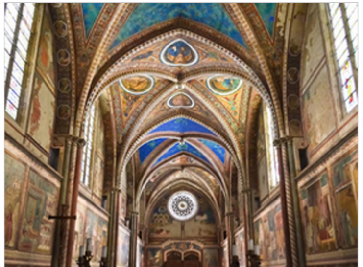
Kościół Santa Maria delle Grazie.

mechanicznego uszkodzenia. W dzisiejszym świecie, pełnym eskalacji zagrożeń i psychozy niepewności otaczającego nas środowiska, nie dziwią monitorowane automatyczne wejścia, limitujące ilość osób mogących jednorazowo zwiedzać mediolański refektarz. Przechodząc przez fragment oszklonego Chiostro Grande, jednego z dziedzińców wchodzących w skład kompleksu klasztornego, każda z grup wprowadzona jest do swego rodzaju szklanej klatki wyłożonej specjalnymi wykładzinami, w której, pozostając przez chwilę zamknięta, zostaje poddana „uwolnieniu” (przez odpowiednio filtrowane powietrze) od kurzu, który od stuleci był głównym czynnikiem degradacji malowidła. Wówczas to, ponownie elektronicznie otwieranymi drzwiami, grupa zwiedzających wpuszczana jest do obszernego, wzniesionego na planie prostokąta, zamykającego od zachodniej strony kompleks klasztorny, refektarza.