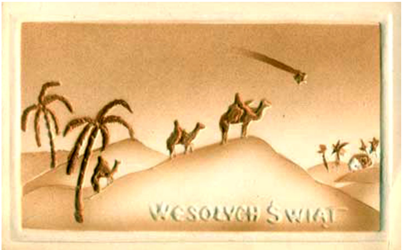
Święta Bożego Narodzenia na starej pocztówce.