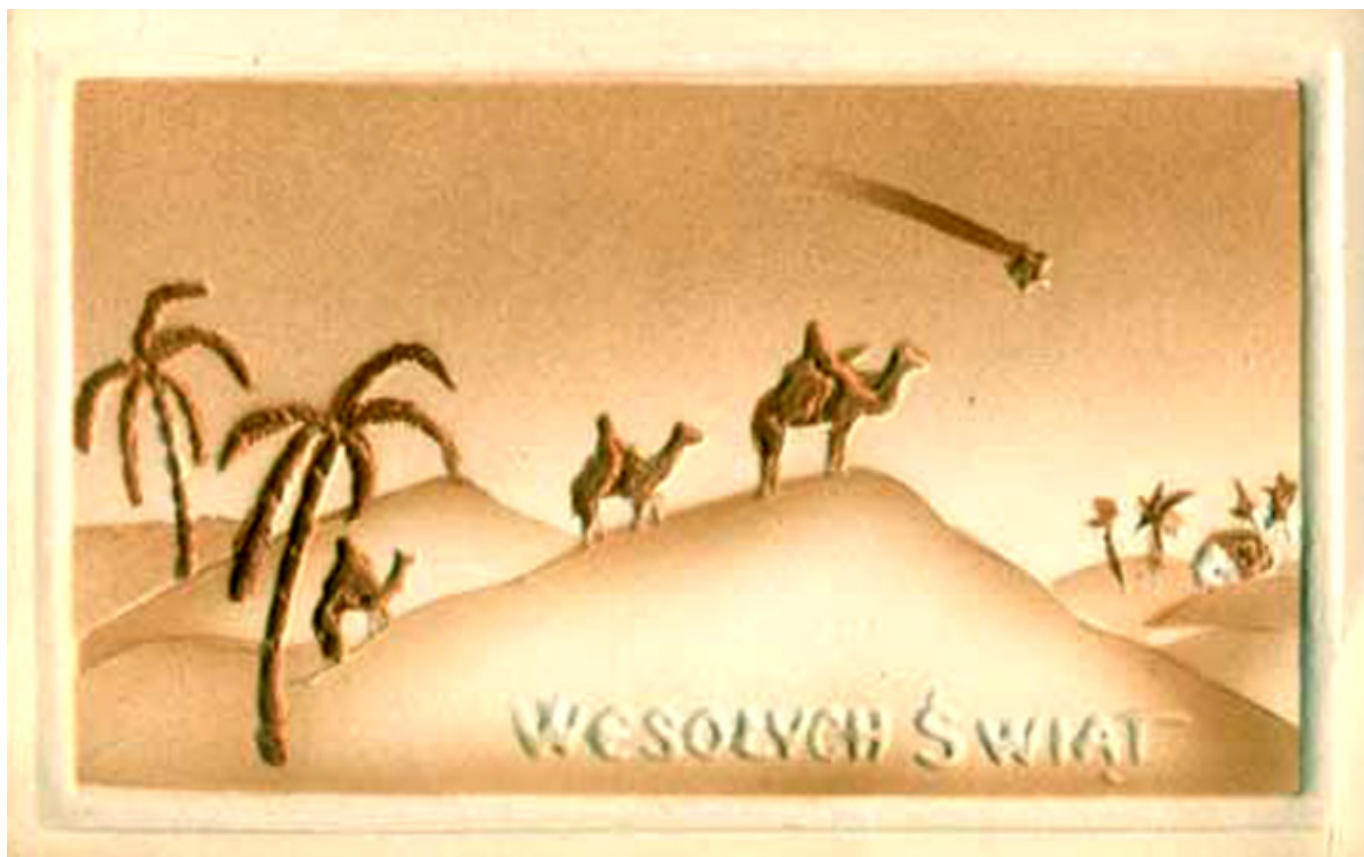
Święta Bożego Narodzenia na starej pocztówce.