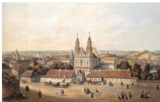
Zygmunt Vogel, Kościół Misjonarzy w Wilnie. Muzeum Narodowe, Kraków.