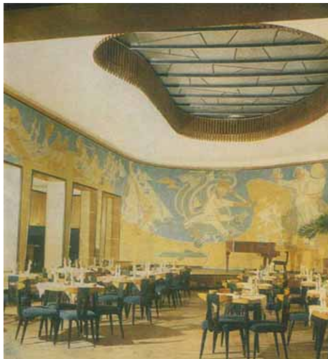
Cafe Neringa w Wilnie

A „Neringa” znalazła kolejne swe wcielenie - jako część składowa „Scandic Hotelu”.