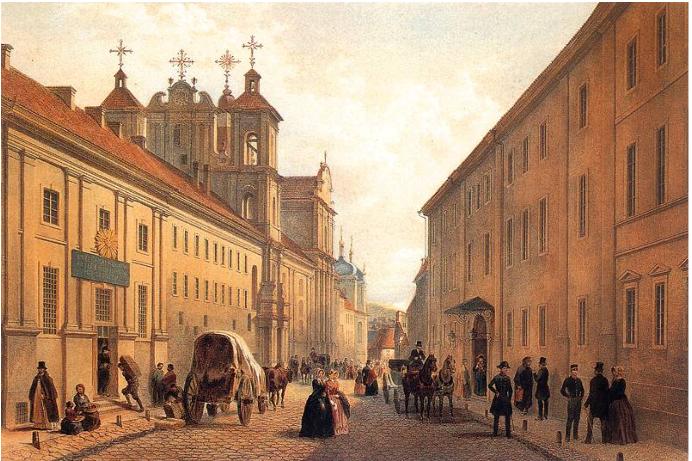
Zygmunt Vogel, Ulica w Wilnie. XIX w. Muzeum Narodowe, Kraków.

Wileńska karta w twórczości Konstantego Ildefonsa Gałczyńskiego.