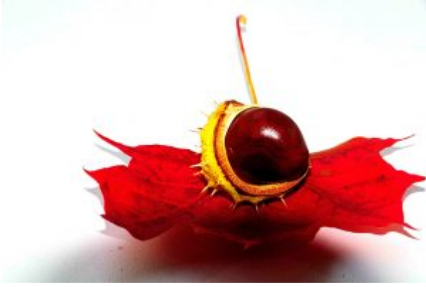
Wileński kasztan, fot. Tadeusz Szostak.