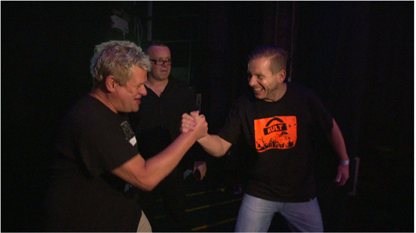
dr z filmu „Amnezja”, Kazik (z lewej)