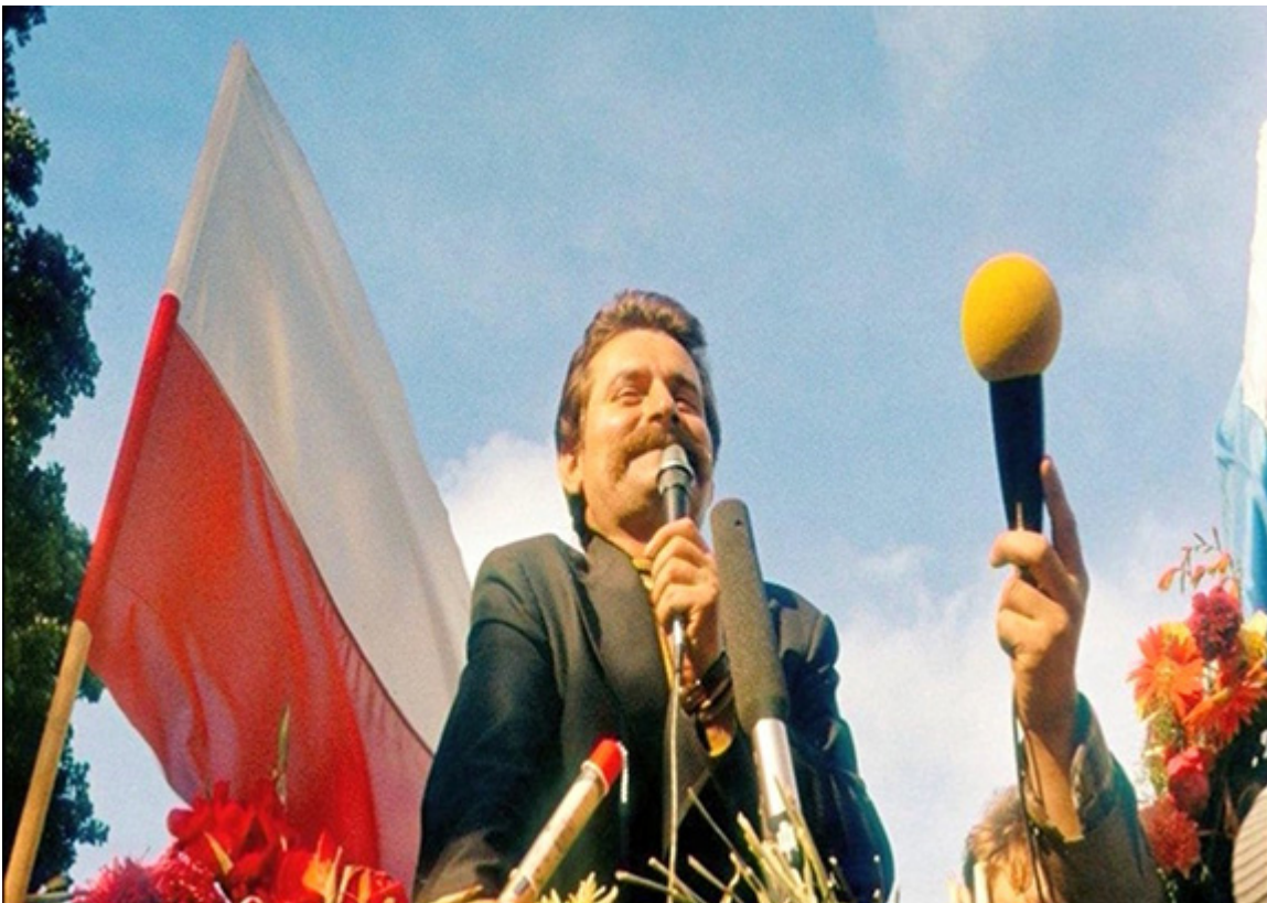
Kadr z filmu „My, Naród”

Film ujawnia nieznaną kulisy słynnego wystąpienia Lecha Wałęsy w Kongresie USA w 1989 r. oraz unikalny, zapomniany i nie pokazywany wcześniej materiał archiwalny.