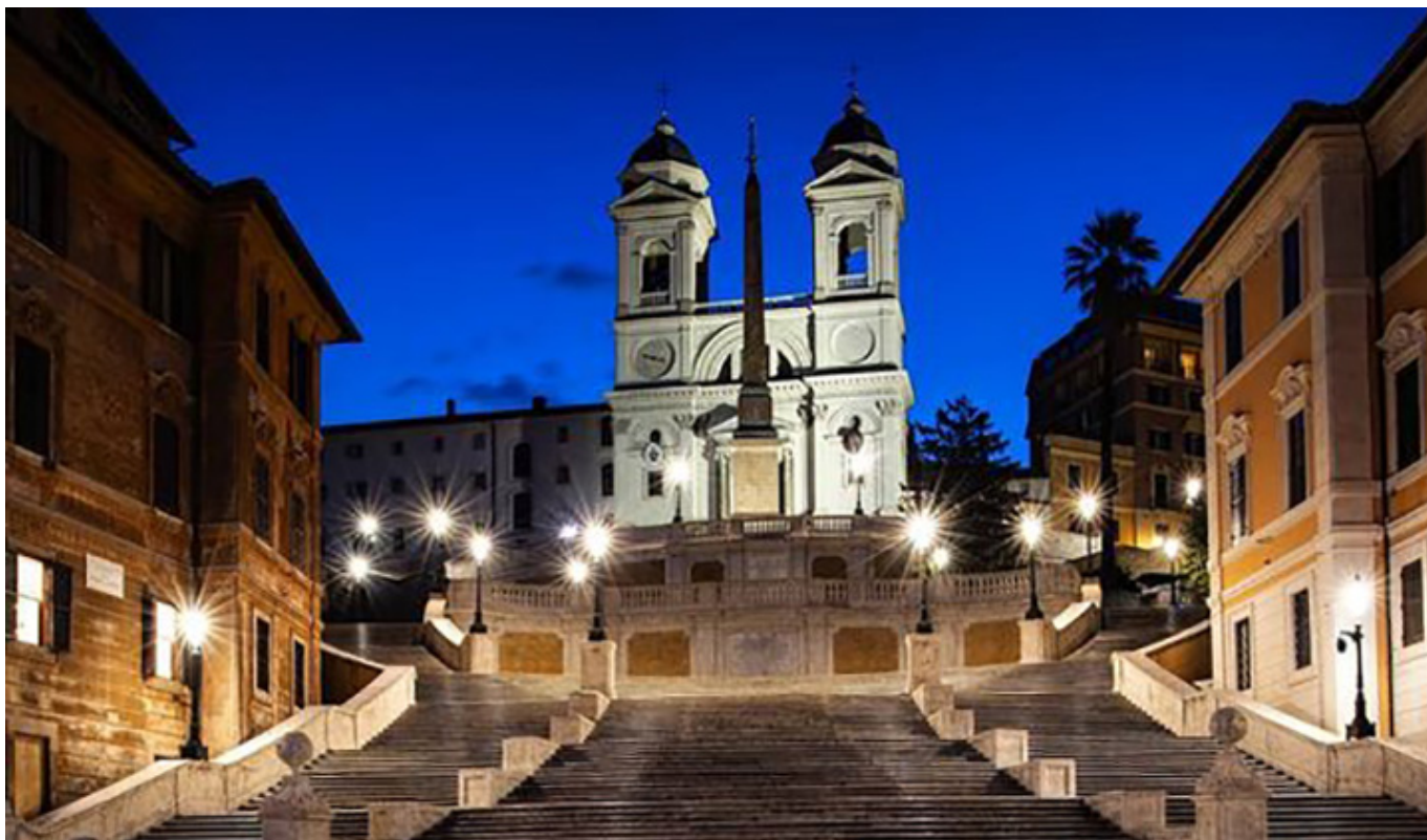
Schody Hiszpańskie, Rzym