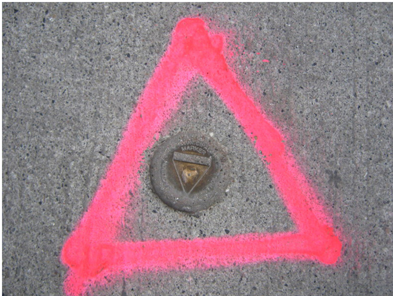
Kazimierz Głaz, Geometric Universe. 1999 r.