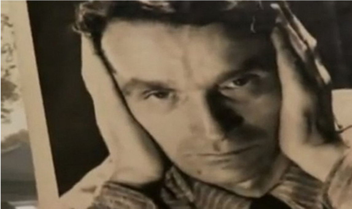
Sergiusz Piasecki. As polskiego wywiadu i znakomity pisarz.

ponieść swojej fantazji. Usprawiedliwiając nieścisłości pierwszego artykułu pokazuje Piaseckiego, który przeżywszy wojnę niemiecko-polską, niczym stary wilk nocami w śniegach przeprowadzał ludzi na Litwę, unikając straży obu armii sprzymierzonych na zgnę Polski: niemieckiej i sowieckiej.