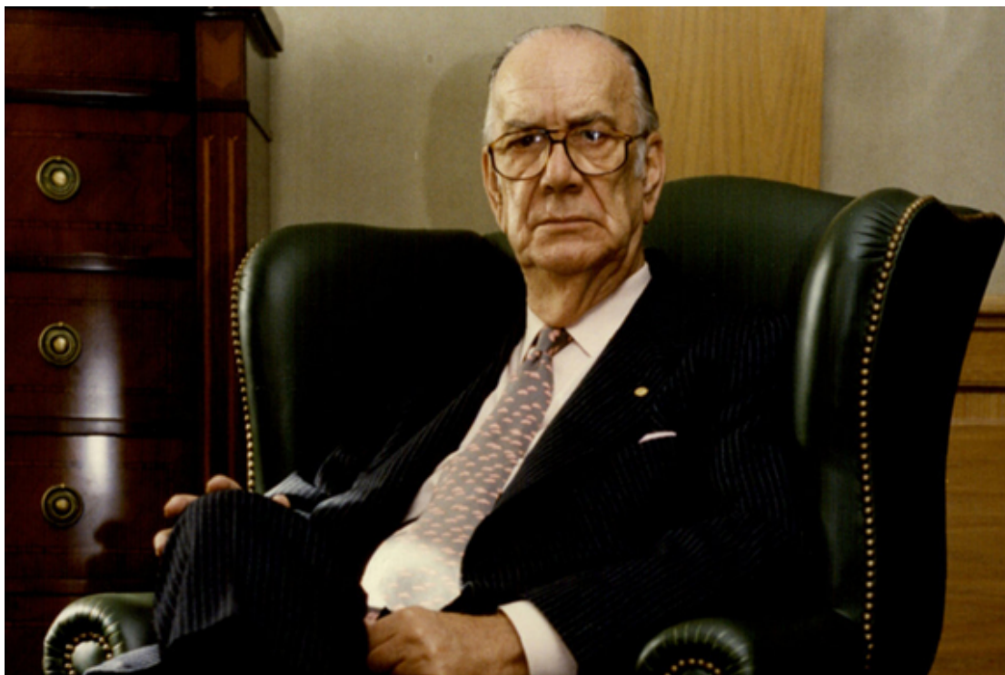
Camilo José Cela

Kiedy nawiązałem z Celą kontakt listowny, obie książki były już w rękach tłumaczy polskich. Pisarz sugerował, bym się podjął przekładu jakiejś innej jego książki. Nie skorzystałem. Najwyraźniej nie miałem nosa do interesu. Zresztą pisałem do niego w sprawie Sergiusza Piaseckiego.