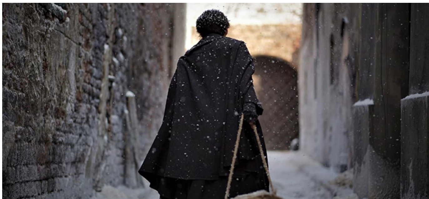
„Nędzarz i Madame”, reż. Witold Ludwig

[REDACTED] Więcej informacji na stronie festiwalu: https://www.austinpolsishfilm.com/