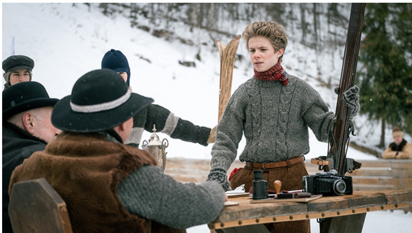
„Marusarz. Tatrzański orzeł”, reż. Marek Bukowski, wyk. Mateusz Janicki, Olga