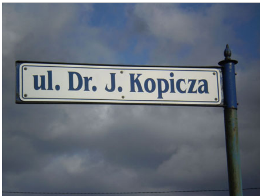
Ulica w Starogardzie Gdańskim, fot. Andrzej Sokołowski.

Na podstawie: T. Nasierowski, Zagłada osób z zaburzeniami psychicznymi w okupowanej Polsce. Początek ludobójstwa, Neriton, Warszawa 2008; Zagłada chorych psychicznie w Polsce 1939-1945, prac. zbior. pod red. Z. Jaroszewskiego, PWN, Warszawa 1993; J. Milewski, Stulecie szpitala w Kocborowie, Starogard Gdański 1995; K. Szwentnerowa, Zbrodnia na Via Mercatorum, Wydawnictwo Morskie, Gdynia 1958; Agata Gut, Eutanazja - ukryte ludobójstwo pacjentów szpitali psychiatrycznych w Kraju Warty i na Pomorzu w latach 1939-1945, strona internetowa Instytutu Pamięci Narodowej;