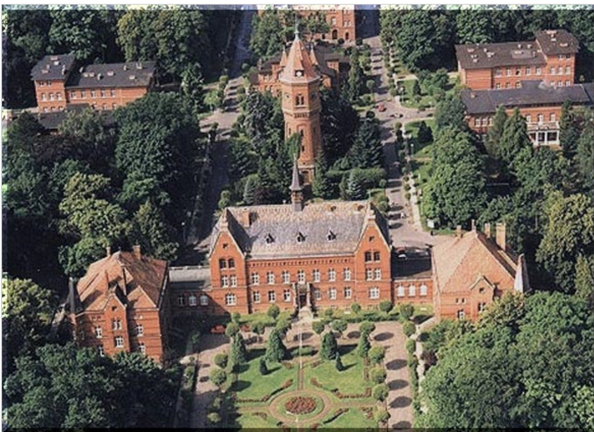
Kocborowo dziś, główny budynek dyrekcji.