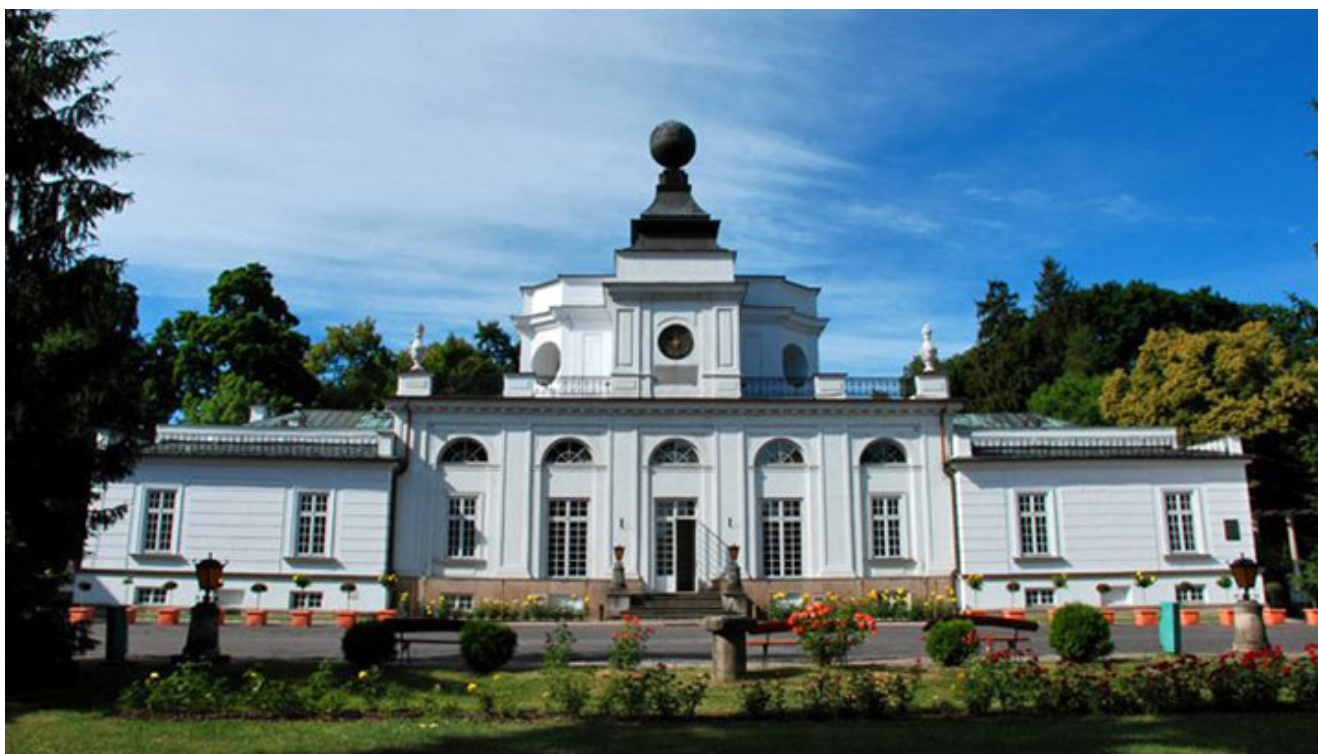
Pałac w Jabłonninie