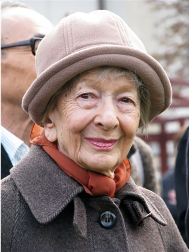
Wisława Szymborska, Kraków 2009

[Redacted text block consisting of multiple horizontal black bars]