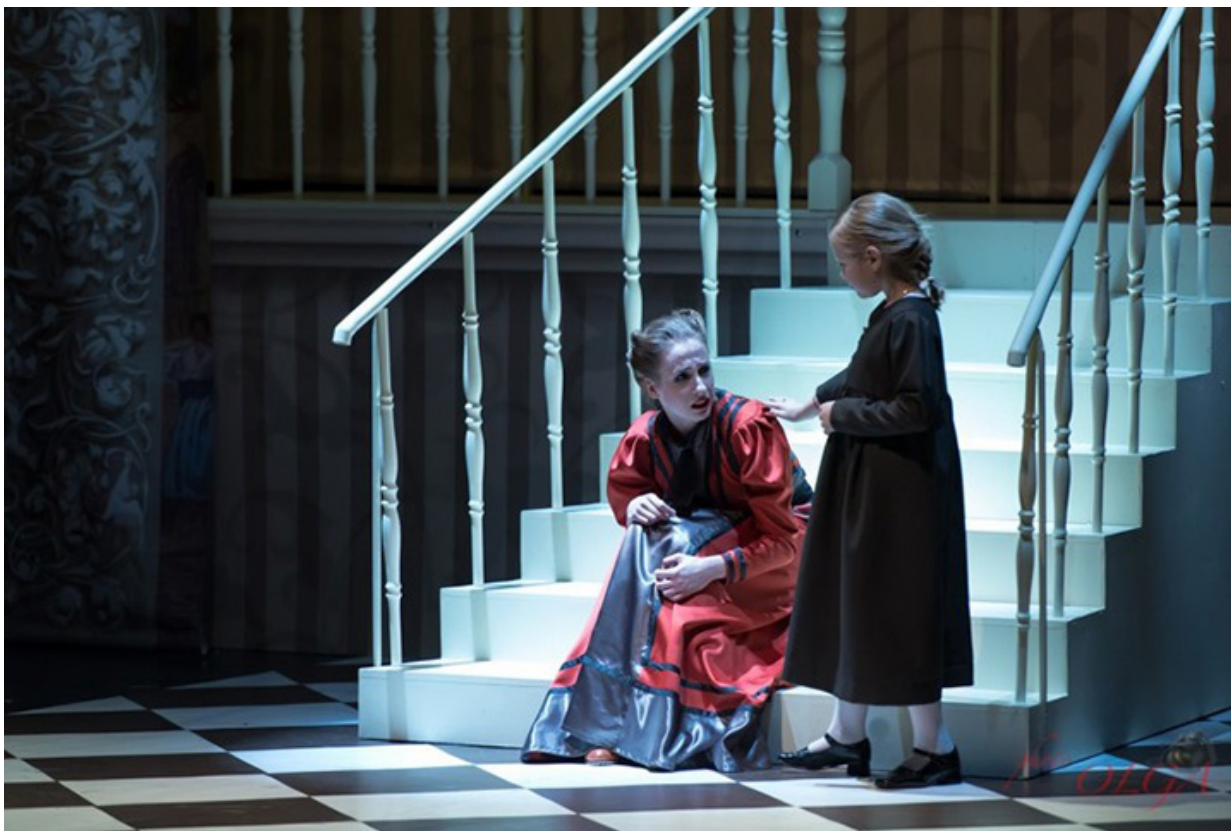
„Księżniczka Sara”, reż. Teresa Kurpias-Grabowska

aktorstwie chodzi, by wywołać emocje, przemyślenia, zafascynować odbiorcę magią teatru. Zgadzam się z tezą Stanisławskiego, że należy pokochać teatr w sobie, a nie siebie w teatrze, więc ta radość, poczucie spełnienia, nie powinny być związane z próżnością.