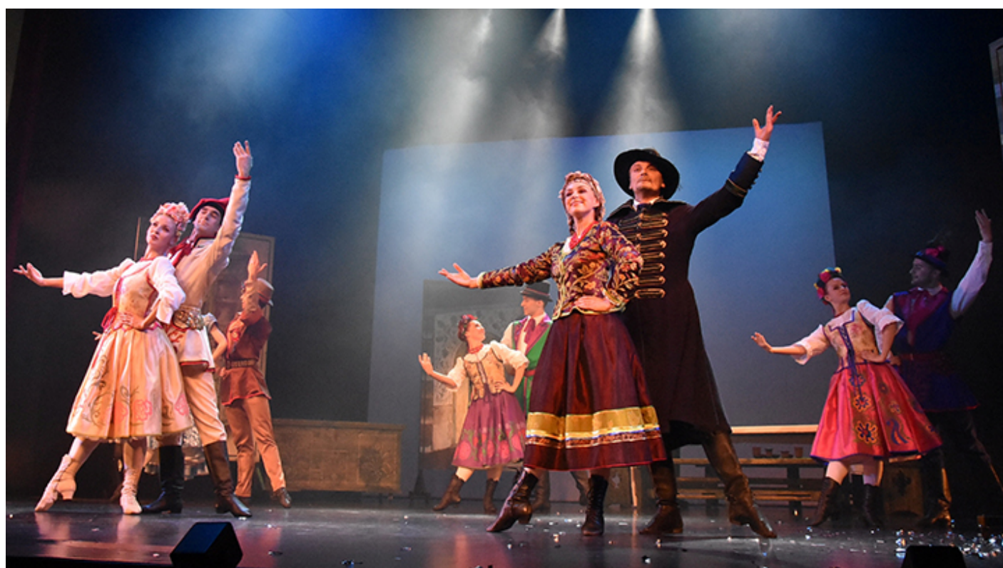
„Wesele w Ojcowie”

Hej, od Krakowa jadę, w dalekie obce strony... i na Listę UNESCO!