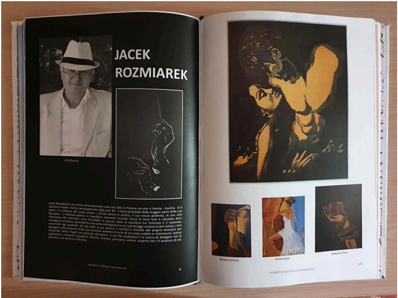
Publikacja na temat twórczości Jacka rozmiarka