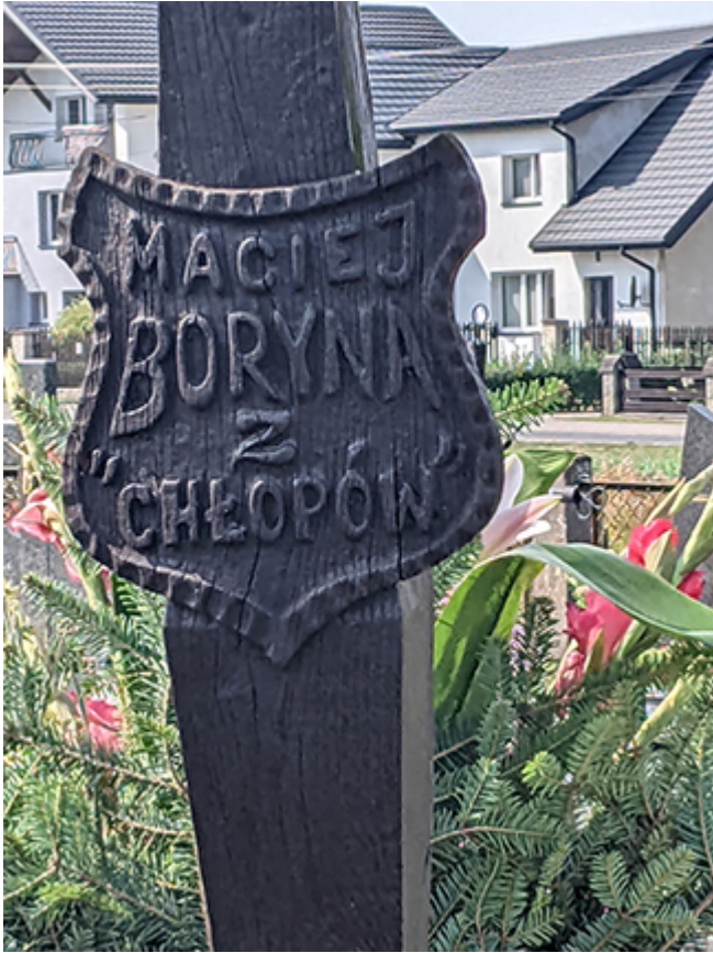
Symboliczny grób Macieja Boryny na cmentarzu w Lipcach Reymontowskich