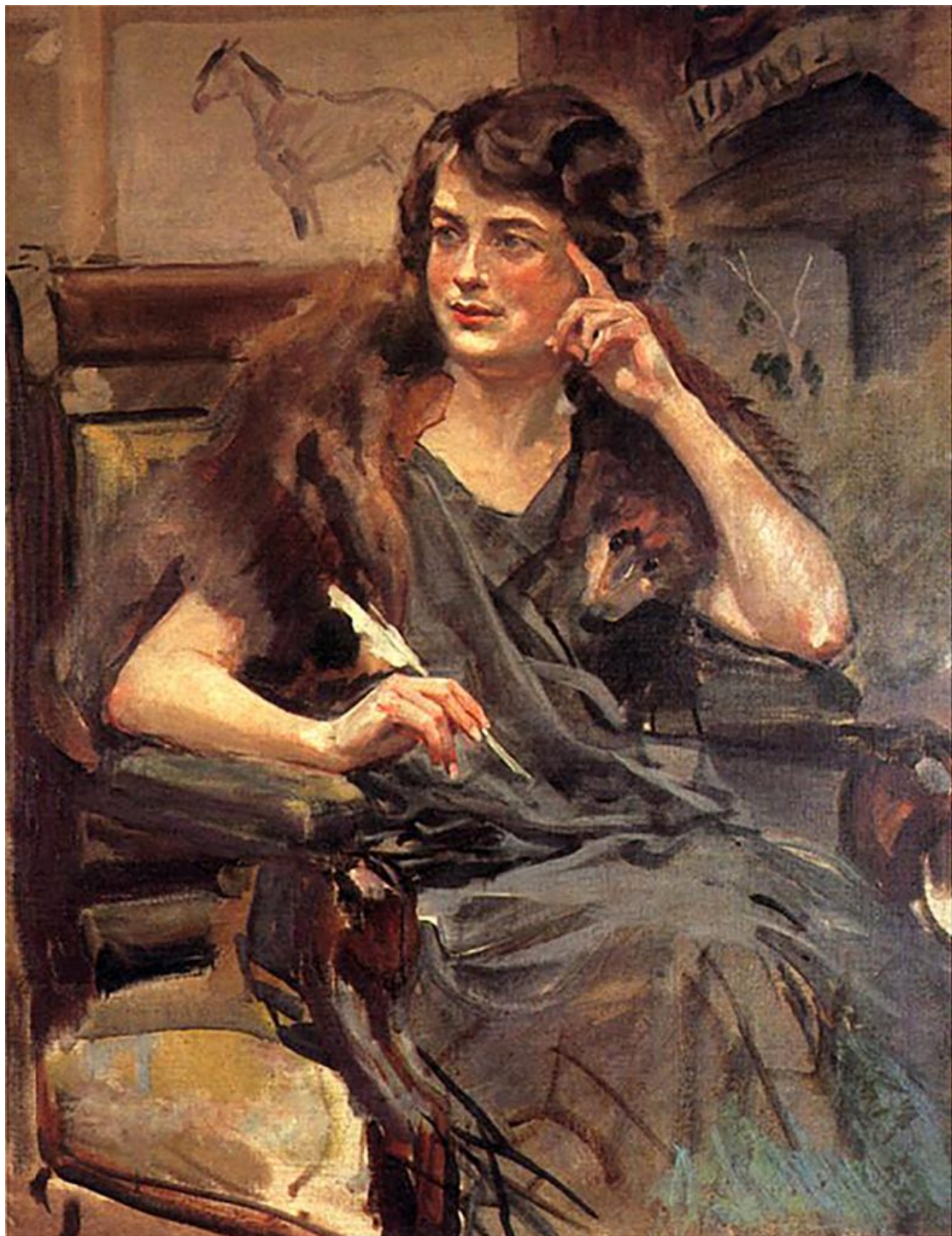
Magdalena Samozwaniec na portrecie pędzla Wojciecha Kossaka.