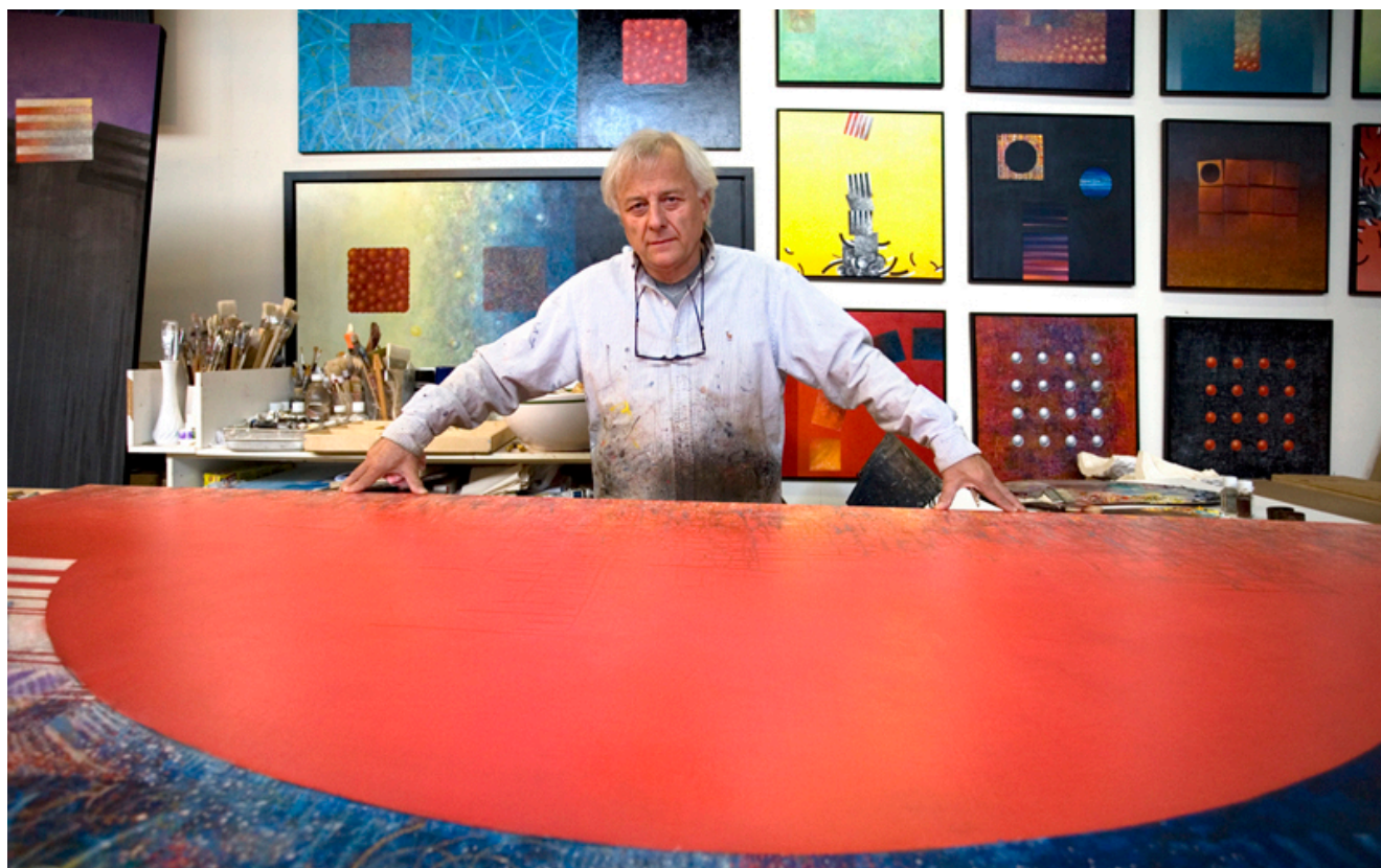
Leszek Wyczółkowski w pracowni.

Joanna Sokołowska-Gwizdka: Pod koniec 2015 roku wyszedł album „Beyond Geometry. The Art of Leszek Wyczolkowski” wieńczący wiele lat Twojej pracy artystycznej. Pierwsza część pokazuje twórczość graficzną i malarską, a druga – to imponująca historia wystaw w Polsce i za granicą.