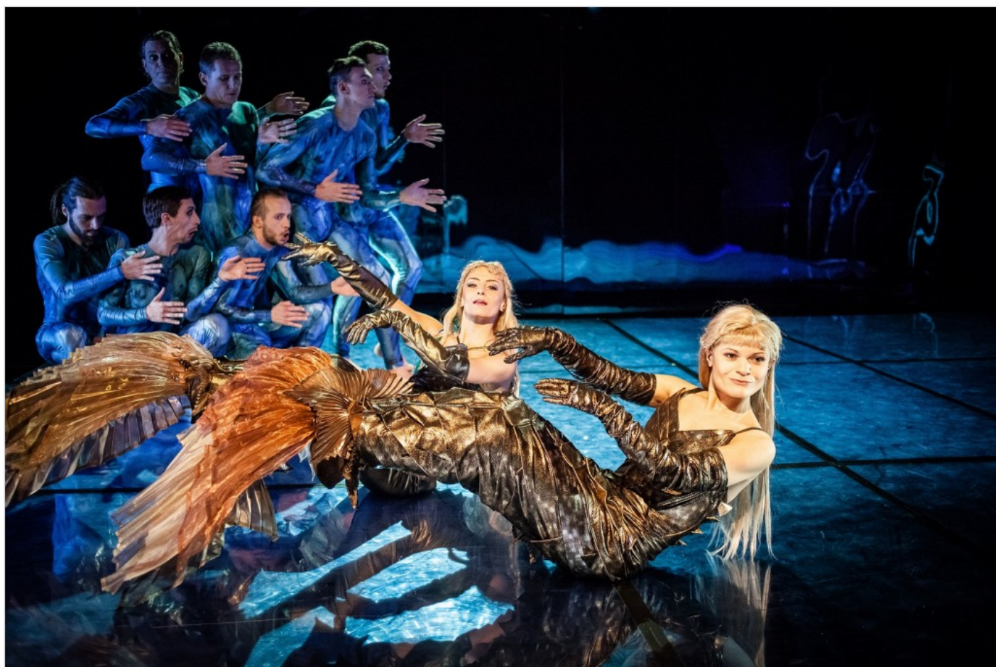
„Mała syrenka”, Wrocławski Teatr Pantomimy