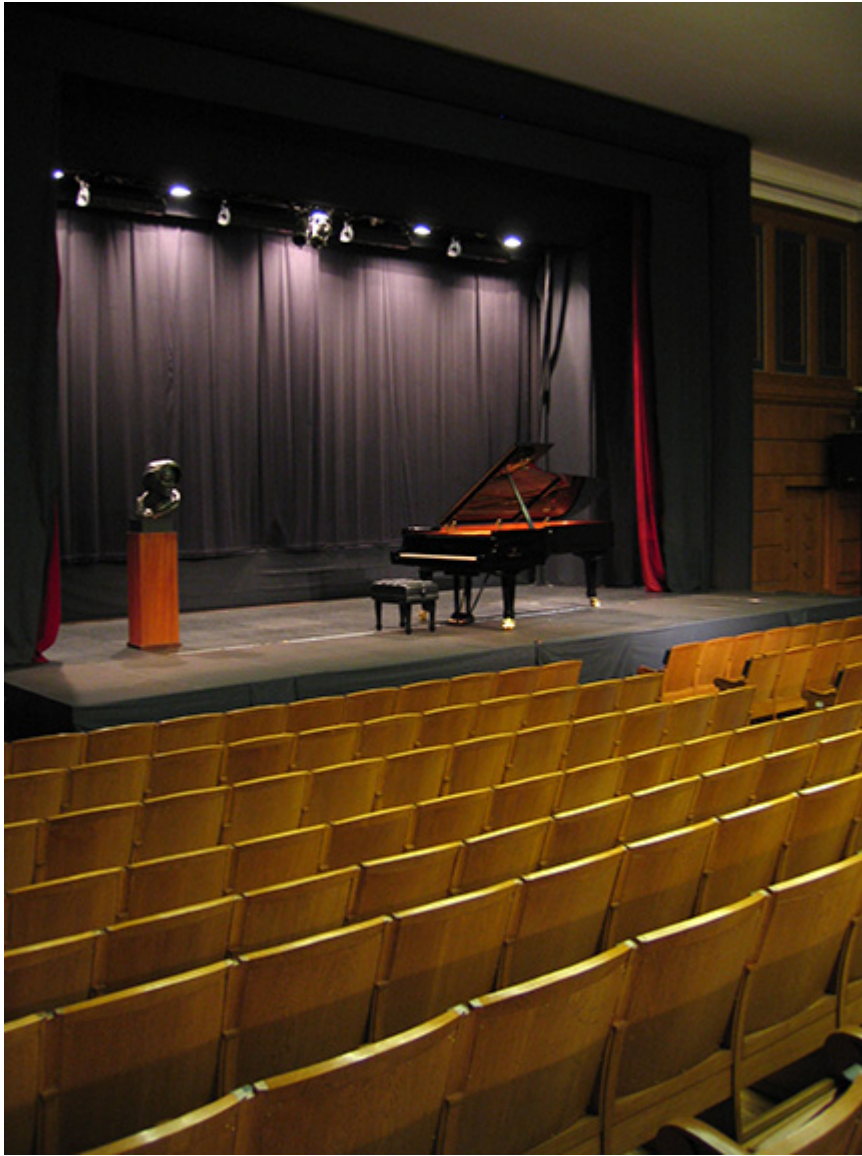
Kadr z filmu „Pianiści - grają Chopina”