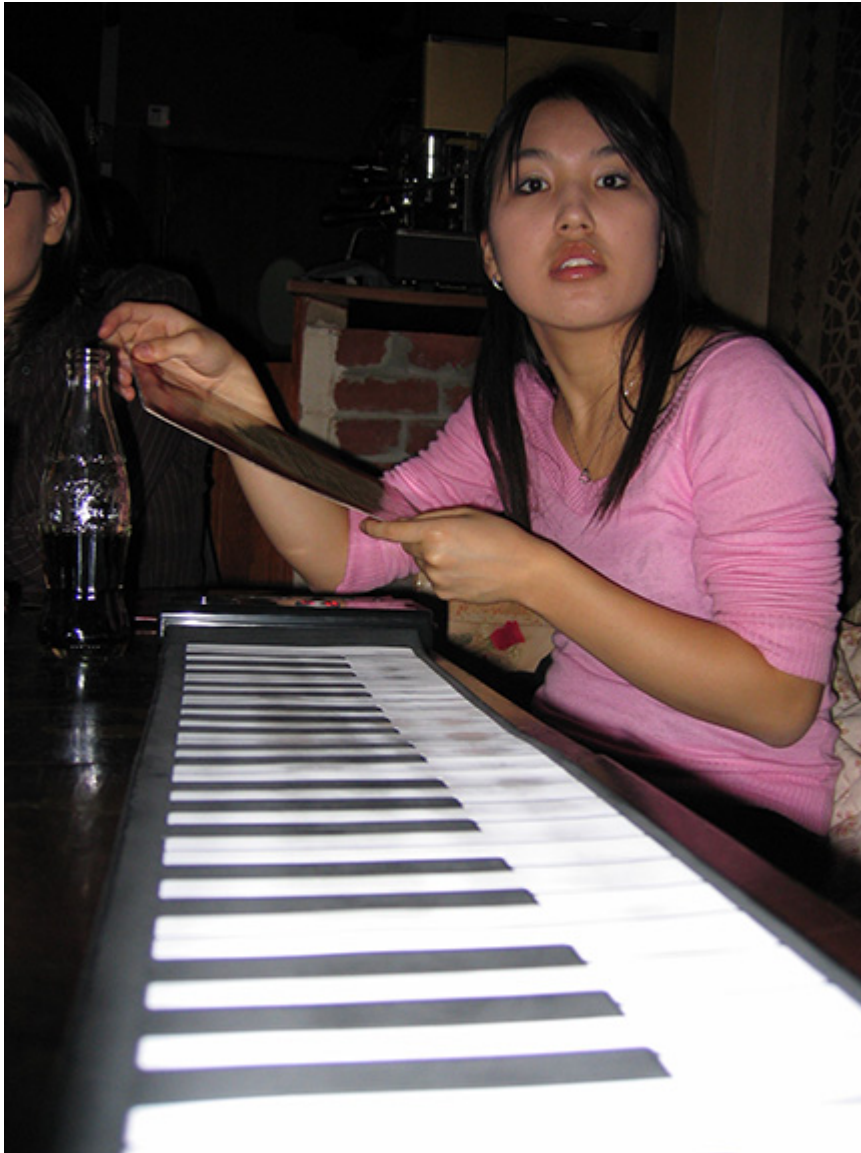
Kadr z filmu „Pianiści – grają Chopina”

Jedna scena z filmu mocno mnie ubawiła: nadopiekuńcza mama masuje ramiona i chusteczką uporczywie wyciera usta jednemu z uczestników Konkursu przed wejściem na scenę. Ubawiła, ale także przypomniała, że startują w nim ludzie młodzi, często przed ukończeniem 20 roku życia, a ich kariera, mimo niejednokrotnie wygranych już wcześniej innych konkursów, dopiero się zaczyna. Po obejrzeniu tego filmu, nie można, więc oprzeć się pokusie zajrzenia do Internetu, żeby sprawdzić, jak ta kariera potoczyła się w przypadku czterech artystów, którym podczas XV Konkursu w 2005 r. świat na chwilę się zatrzymał. Niektórym z nich mogło się nawet wydawać, że to koniec świata.