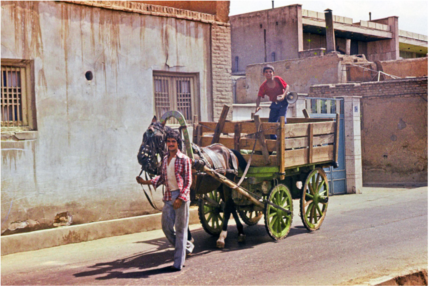
Iran, Teheran, sierpień 1978 r.