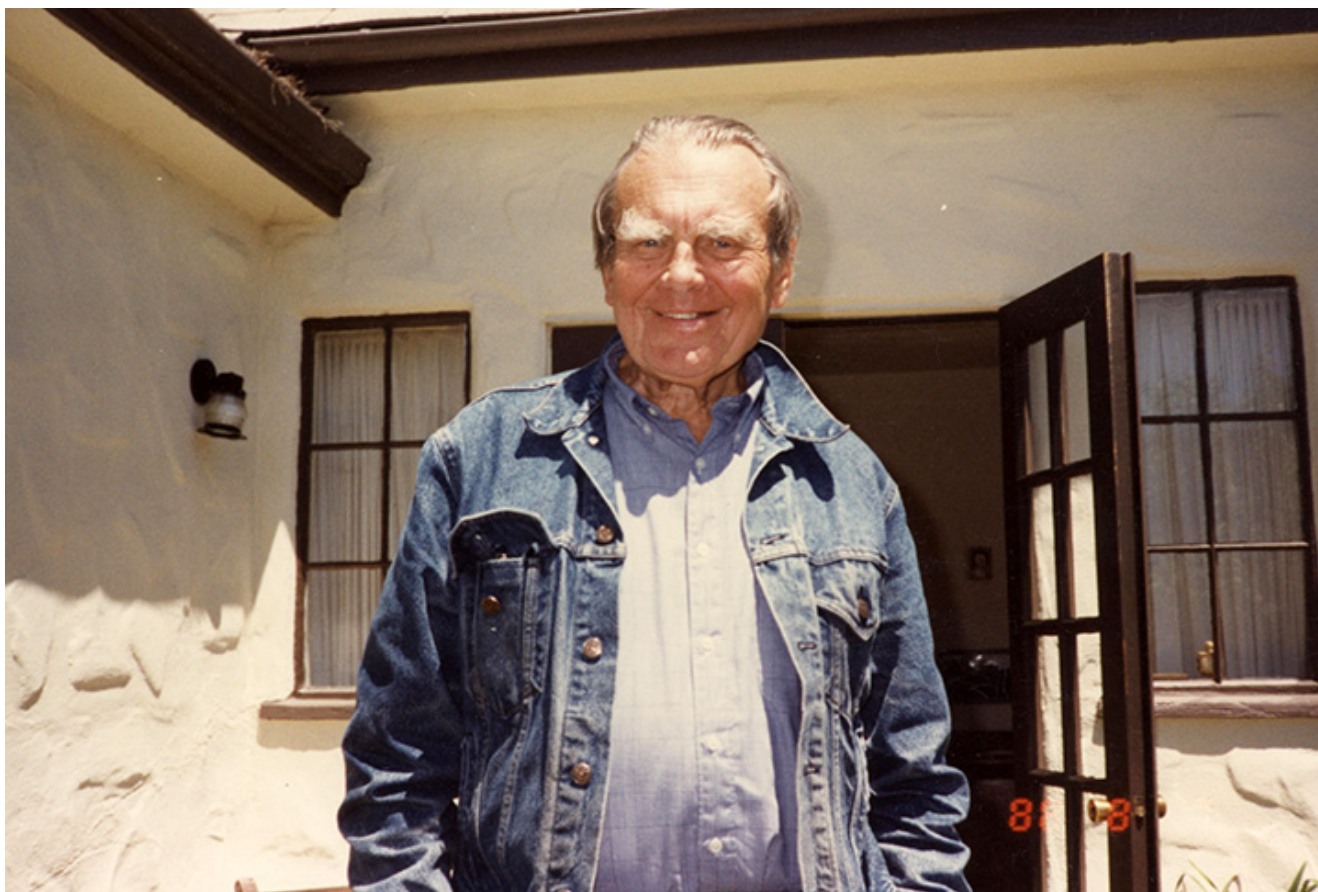
Czesław Miłosz w Berkeley