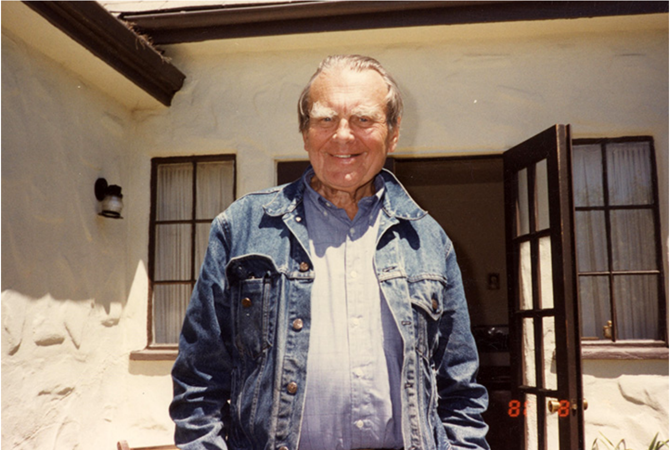
Czesław Miłosz w Berkeley