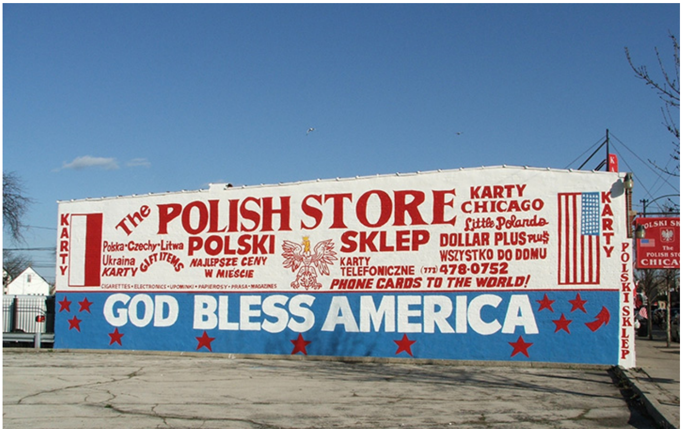
Chicago, fot. A. Lizakowski

Przeżycia osobiste opisanych przez nas osób, wybitnych Polaków w pewnym stopniu powinny oddać posmak i charakter Ameryki z przełomów XVIII w i XIX oraz tej z przełomu XIX i XX wieku. Wiele spostrzeżeń sprzed dwustu czy stu lat wciąż jest aktualnych. Wiele motywów wyjazdu z kraju, opuszczenia go jest wciąż mino upływu tak wielkiego czasu bardzo podobna. Podobne są też początki i kłopoty adopcyjne. Najpierw jest wielka chęć wyjazdu za wielką wodę, szukanie tam jakby ratunku od problemów codzienności we własnym kraju, wiara, że tam będzie lepiej. Po przyjeździe następuje stres, rozczarowanie, jakiś wewnętrzny ból, i dla wielu przekonanie, że jednak dokonali złego wyboru, powinni zostać u siebie. Zbyt wielkie widzą różnice, może nawet przeżywają szok kulturowy. Mijają najpierw miesiące i lata emigrant staje się coraz bardziej „odporny na Amerykę” osamotnienie, zostaje zastąpione pracą, ciężką pracą na dodatek mało płatną która pochłania większą część życia.