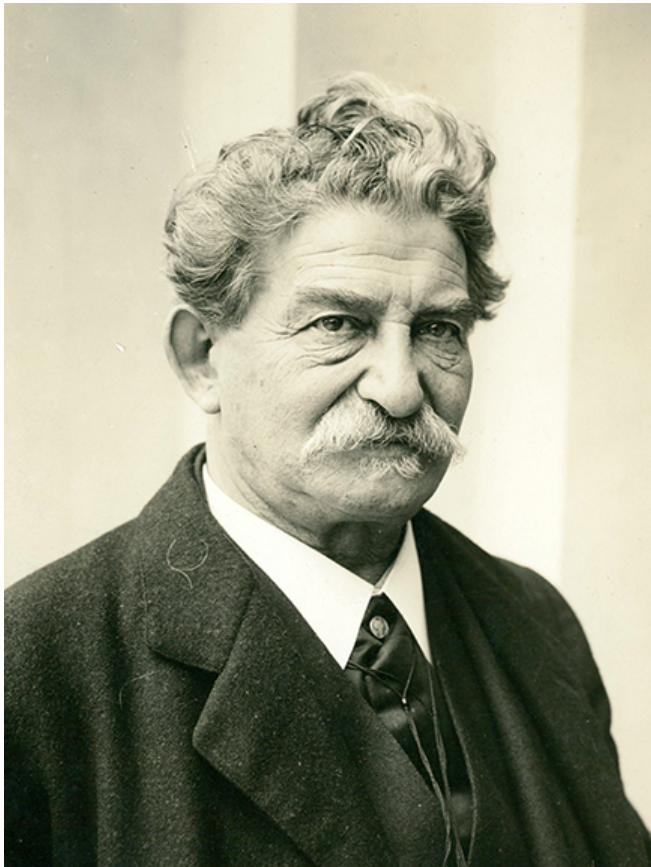
Aleksander Sochaczewski