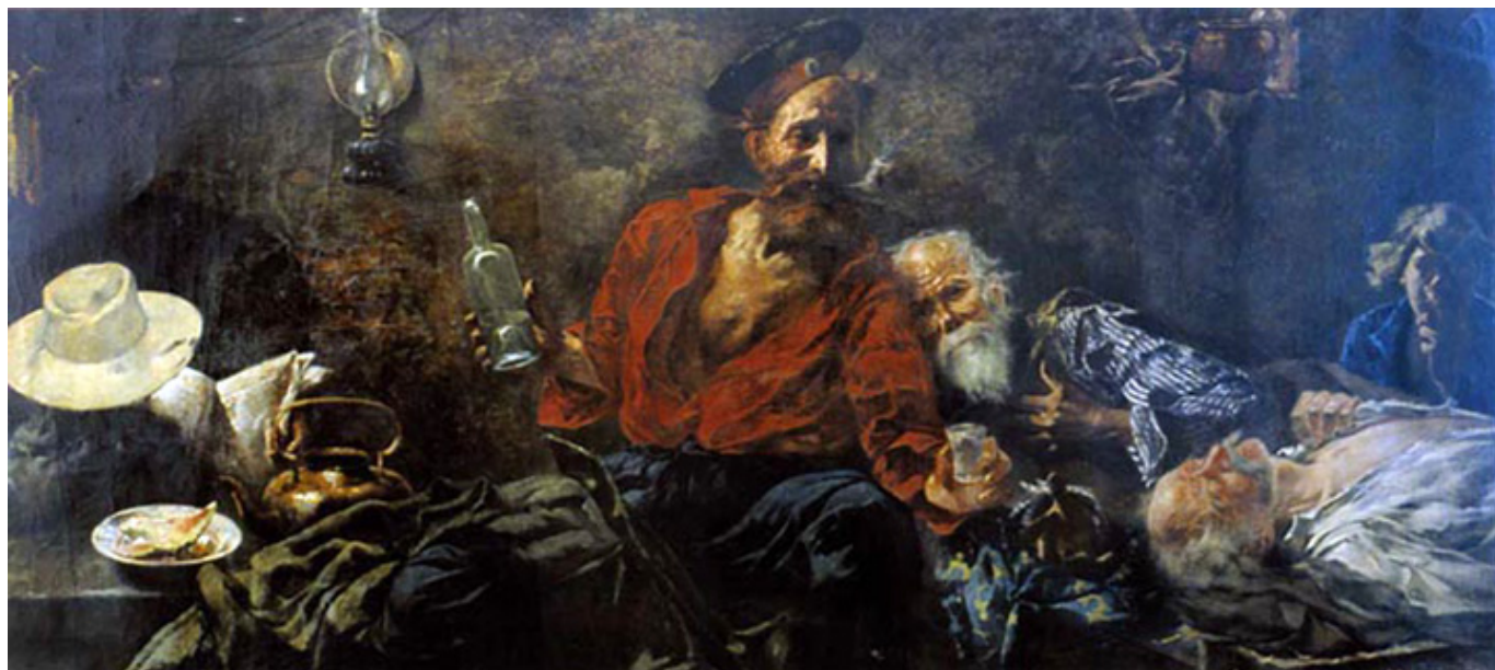
Lucjan Wędrychowski, Na zesłaniu , olej na płótnie, 108 x 238 cm, Muzeum Śląska Opolskiego, Opole