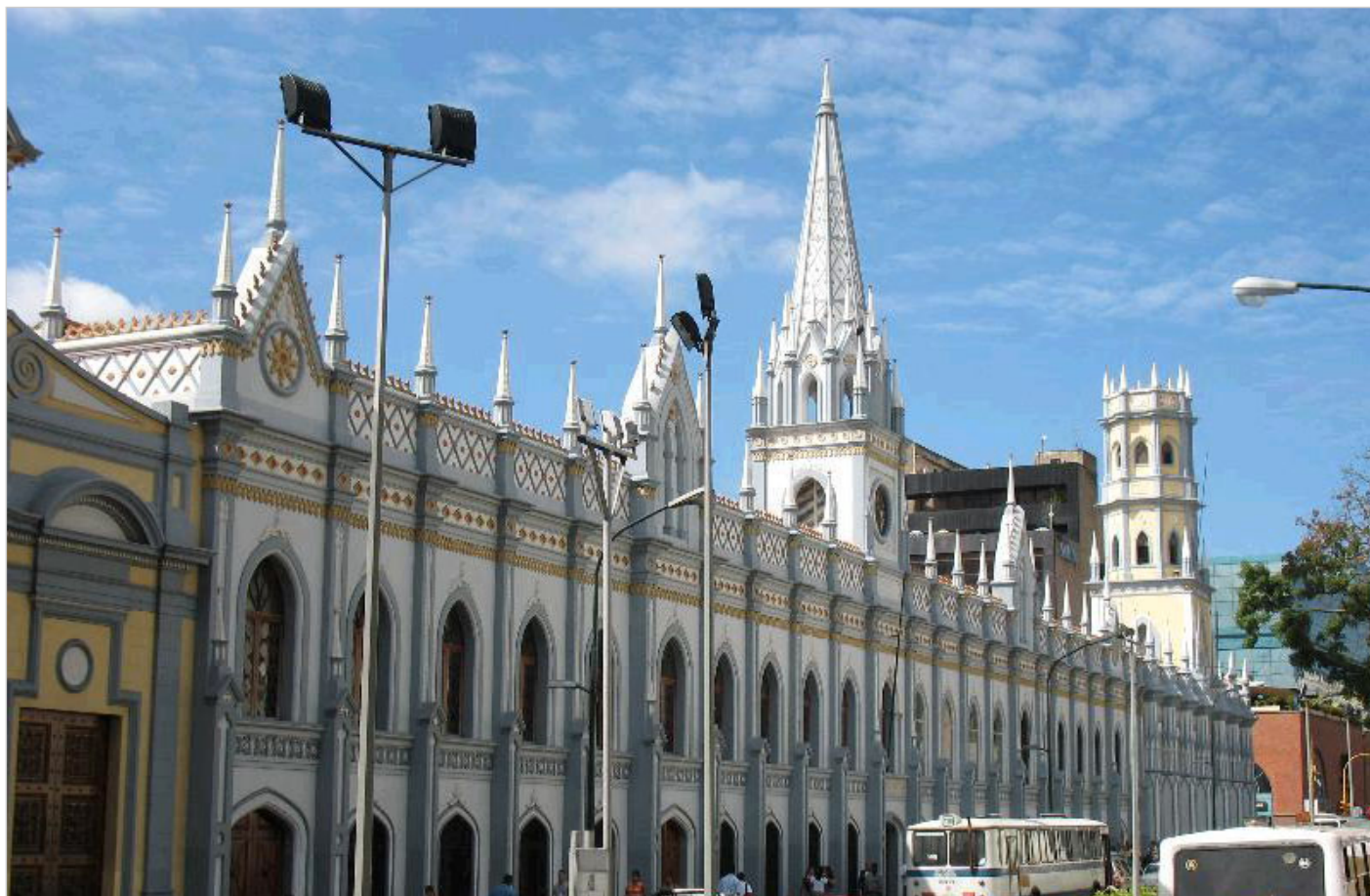
Biblioteca Nacional, Caracas

Ameryka Łacińska, Hiszpania i Portugalia oczami polskiego iberysty