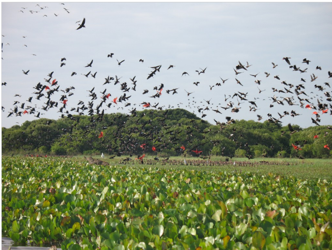
Los Llanos, Venezuela

Wciąż myślałem o powrocie na moje Wielkie Równiny i jakoś mniej więcej w tym okresie wybrałem się sam do stolicy stanu Guárico, San Juan de los Morros, gdzie odwiedziłem Dom Kultury, a potem dotarłem w okolice El Sombrero i pewien przypadkowo spotkany farmer argentyńskiego pochodzenia oprowadził mnie trochę po swoich włościach. To wtedy zobaczyłem na gałęzi drzewa długiego, intensywnie zielonego pięknego węża, który w Wenezueli zwany jest verdegallo ,