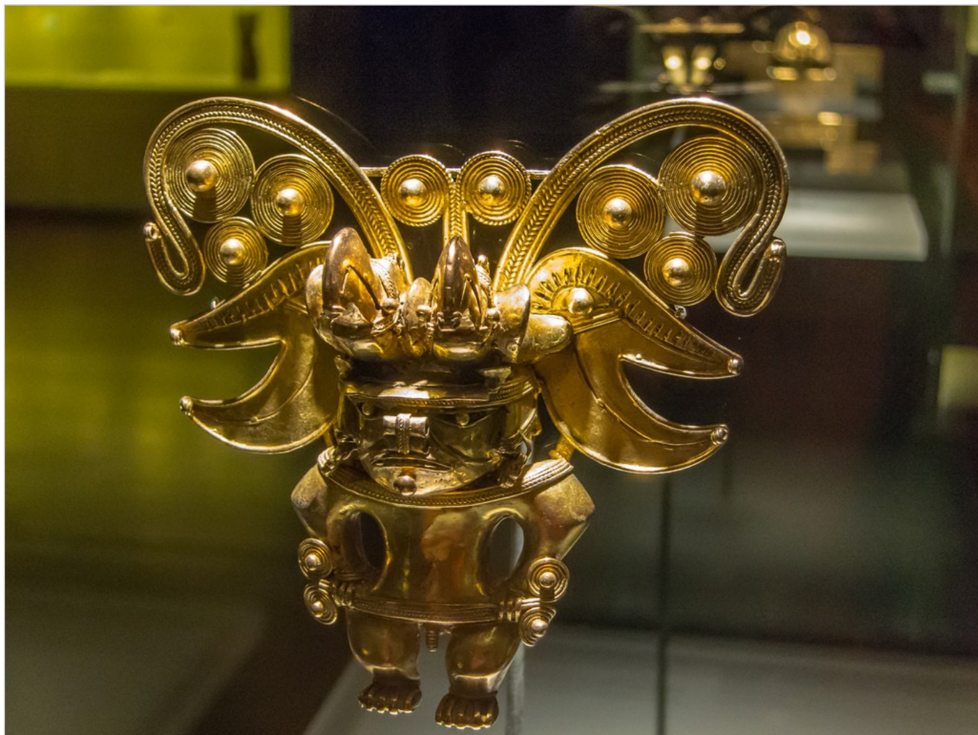
Museo del Oro, Bogota