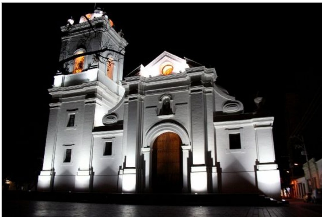
Santa Marta. Kolumbia

się wówczas dość wąską i na dodatek mocno cuchnącą strużką wody. Kopalnia soli imponuje wielkimi rozmiarami i wykutą w jej wnętrzu katedrą z godnymi uwagi ołtarzami rzeźbionymi w solnej skale. Kolumbijczycy podkreślają z dumą, że to jedyna taka katedra na świecie. Gdy próbowałem zaprzeczyć wymieniając Wieliczkę, przewodnik, korpulentny starszy pan, uciął krótko: „No tak, ale Wieliczka jest o wiele mniejsza”. I tu musiałem przyznać mu rację.