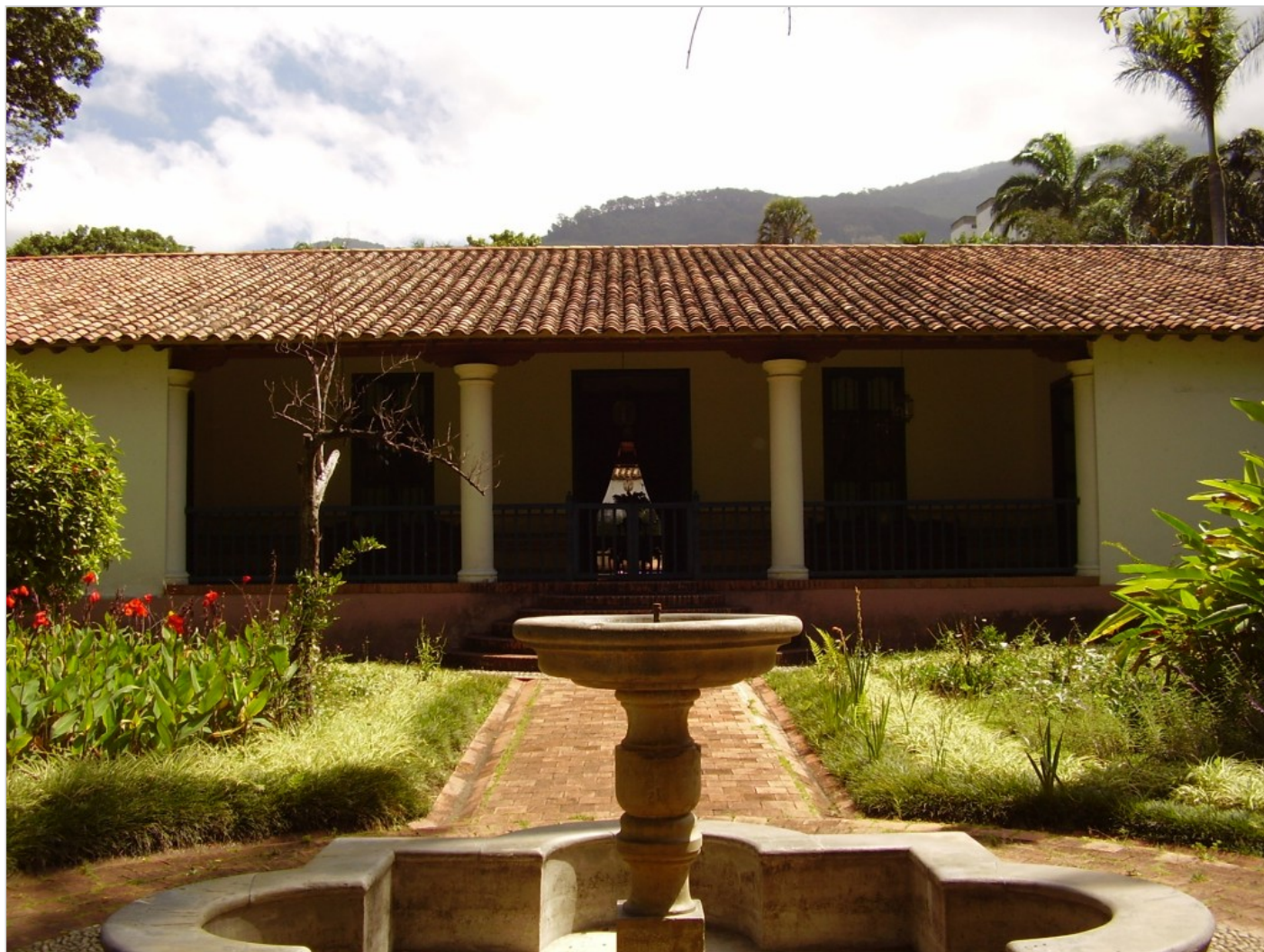
Quinta Anauco, Caracas