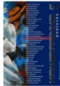
Kawiarenka Poetycka 5 Agnieszka Kuchnia - Wołosiewicz