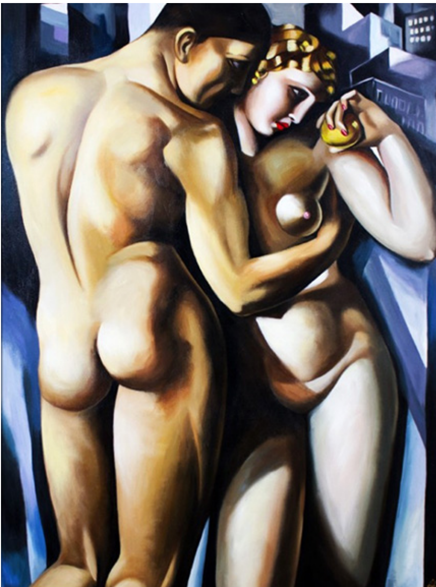
Tamara Łempicka, Adam i Ewa, 1932 r.

Wielu z aktorów hollywoodzkich kolekcjonowało obrazy Tamary. Jedną z największych kolekcji miał Jack Nicholson, który interesował się późniejszym okresem w twórczości artystki, malarstwem abstrakcyjnym. Zafascynowana Łempicą, była także Madonna, wielka wielbicielka i kolekcjonerka jej obrazów. Madonna wykorzystwała pomysły Łempickiej do stworzenia swojego image'u , a także wielokrotnie w swoich wideoklipach opierała się na stylu stworzonym przez malarkę.