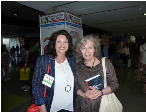
Z pisarką Ewą Stachniak