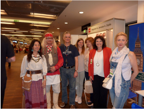
Z czytelnikami oraz pisarzem, piszącym o historii Teksasu, przebranym za Indianina