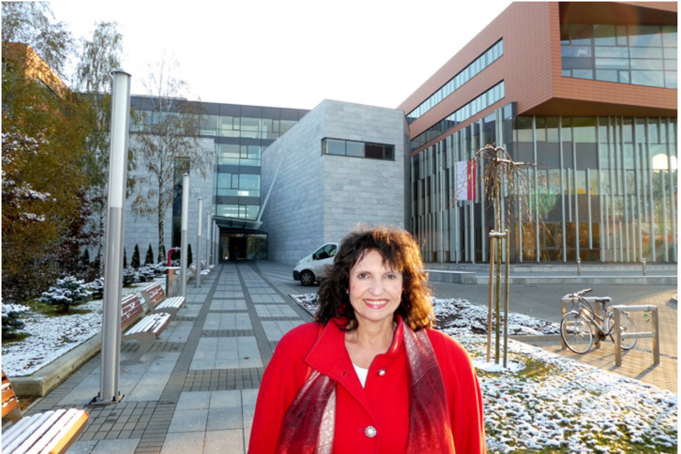
Przed wejściem na Wydział Filologiczny Uniwersytetu Łódzkiego, gdzie miała miejsce prelekcja.