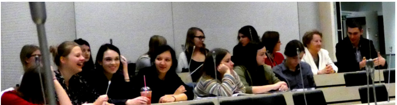
Na prelekcję przyszło liczne grono studentów Wydziału Filologicznego i wykładowców.