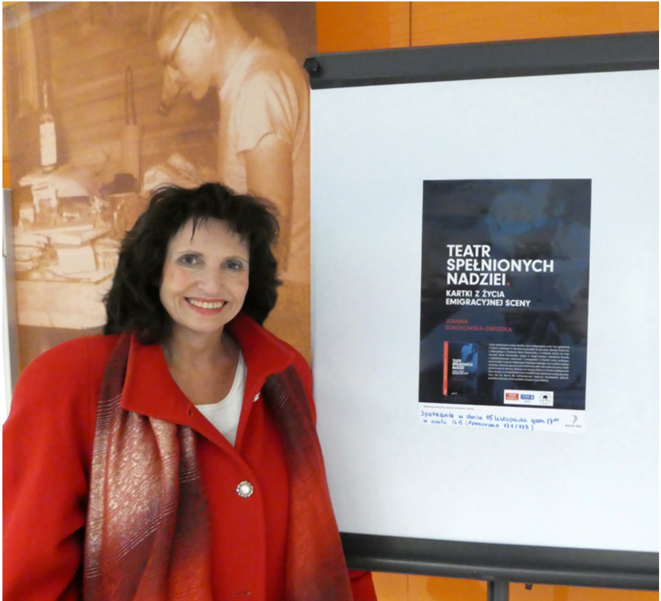
Na Wydziale Filologicznym Uniwersytetu Łódzkiego. Plakaty wisiały w głównym holu.