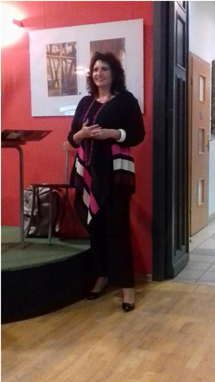
Miejska Biblioteka Publiczna w Łańcucie