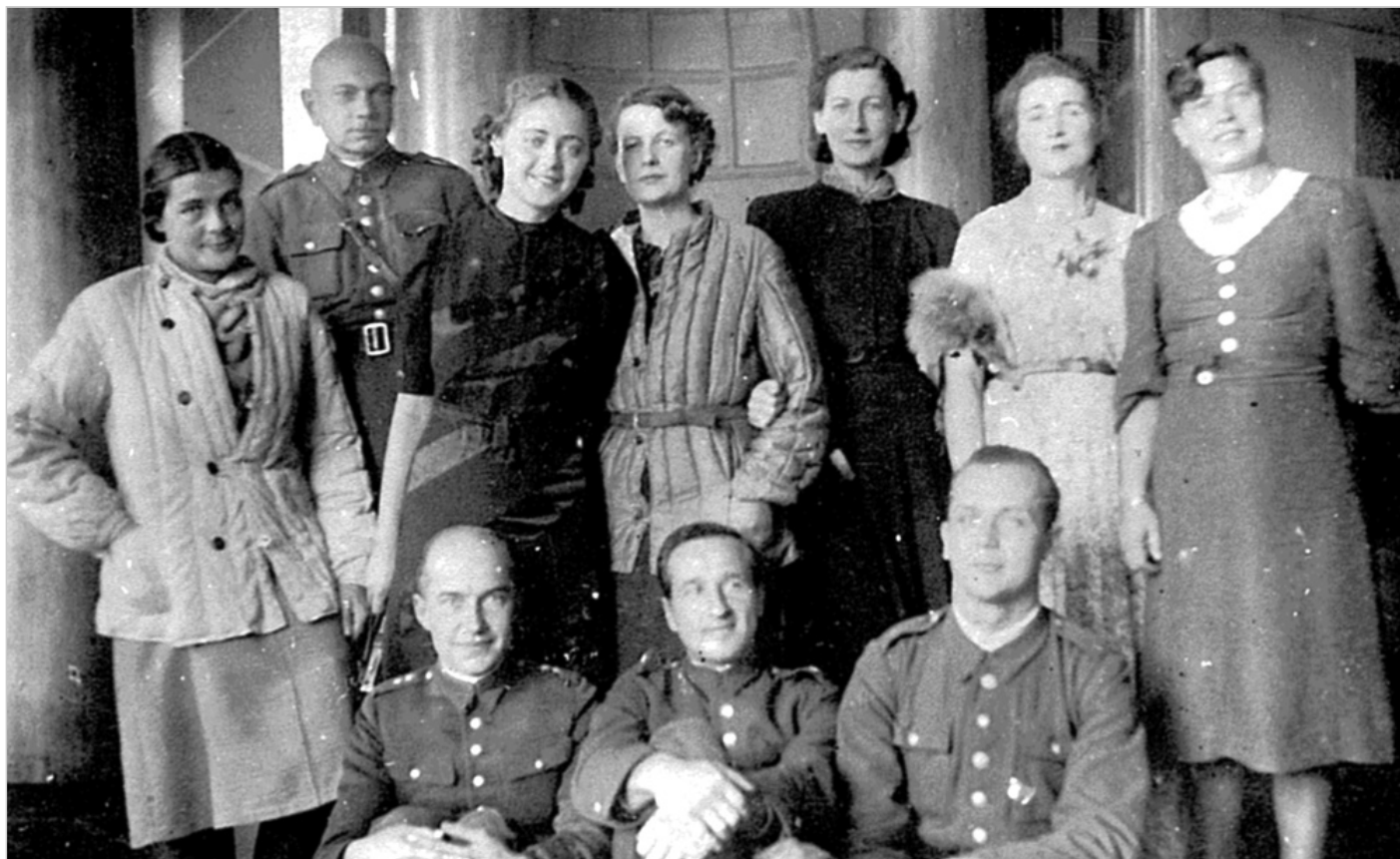
Zespół aktorski 2 Korpusu w Buzułuku - 1941 r.