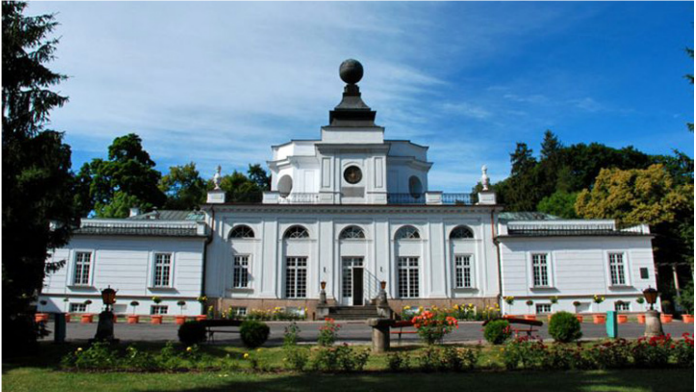
Pałac w Jabłonnie