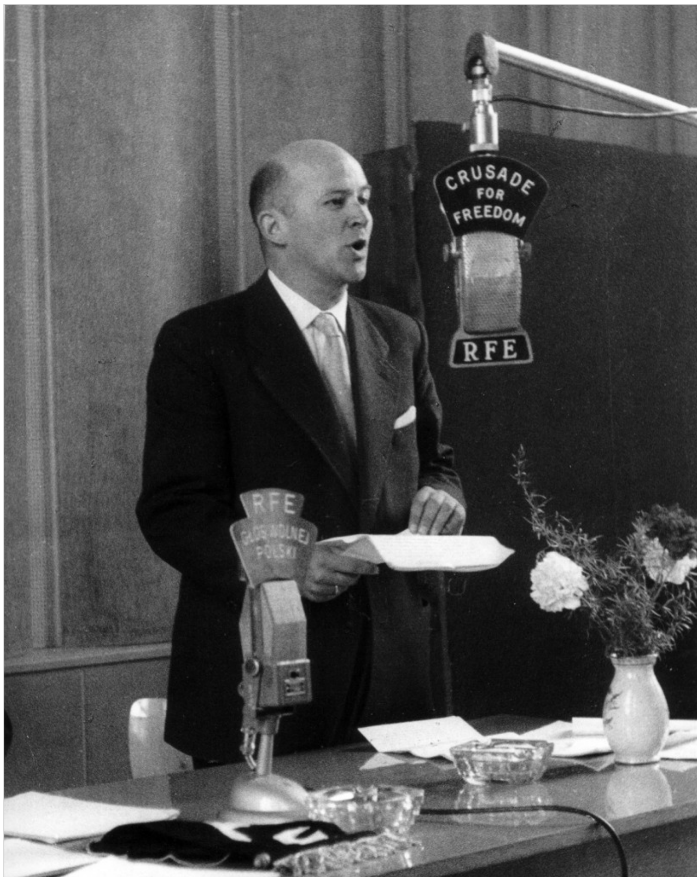
Jan Nowak-Jeziorański w 1957 r., fot. ze zbiorów Narodowego