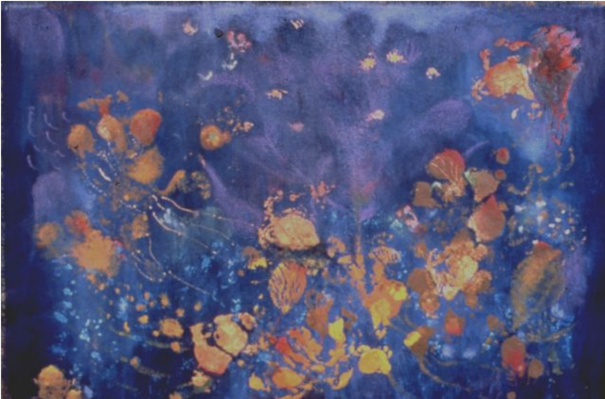
Vers Libre V