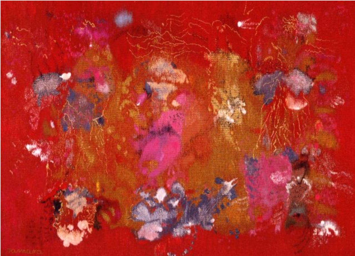
Vers Libre VIII