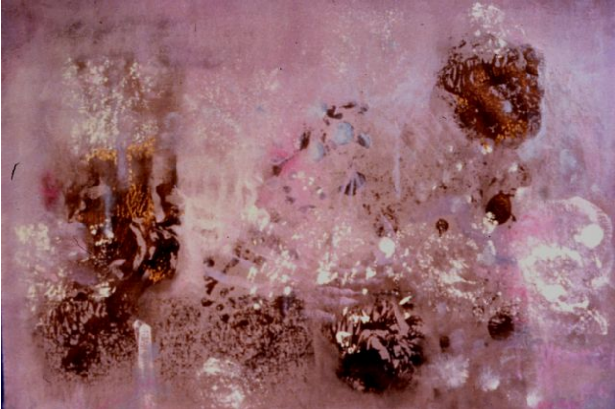
Vers Libre III