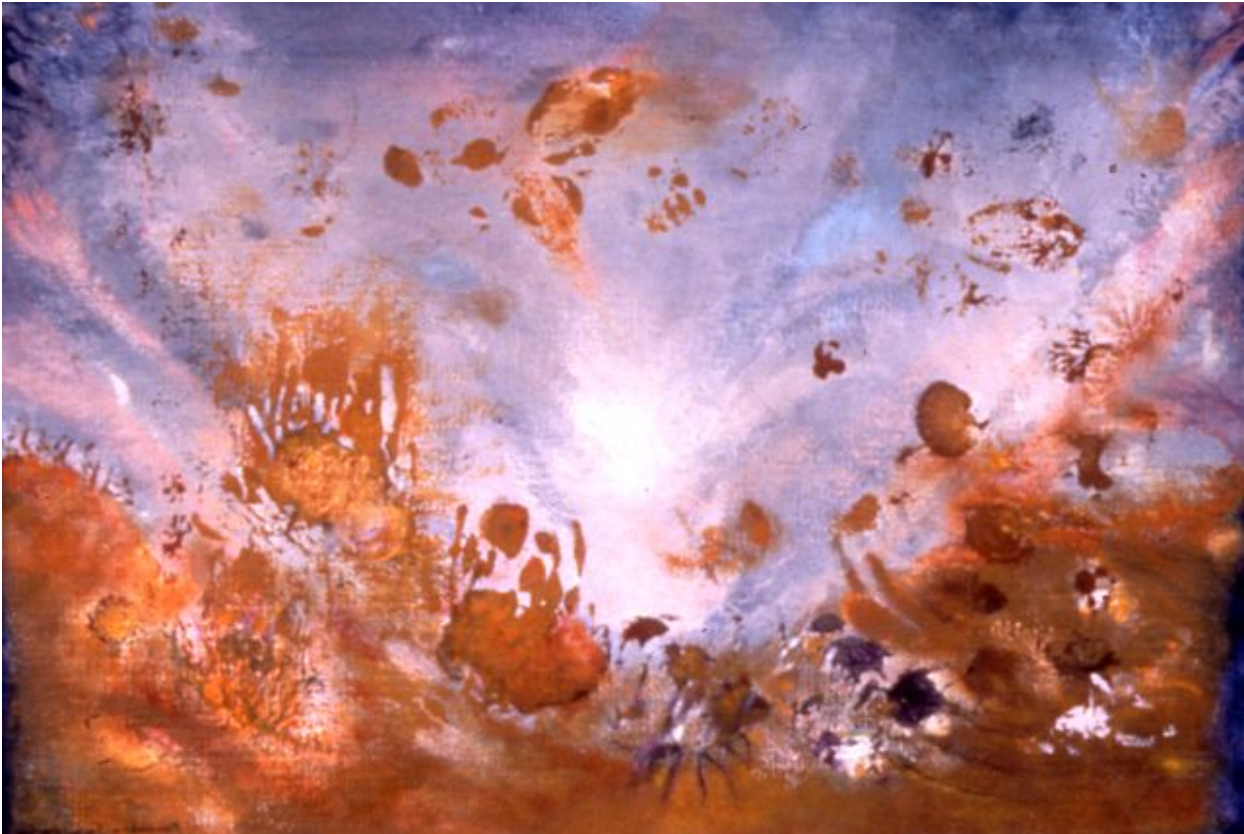
Vers Libre II