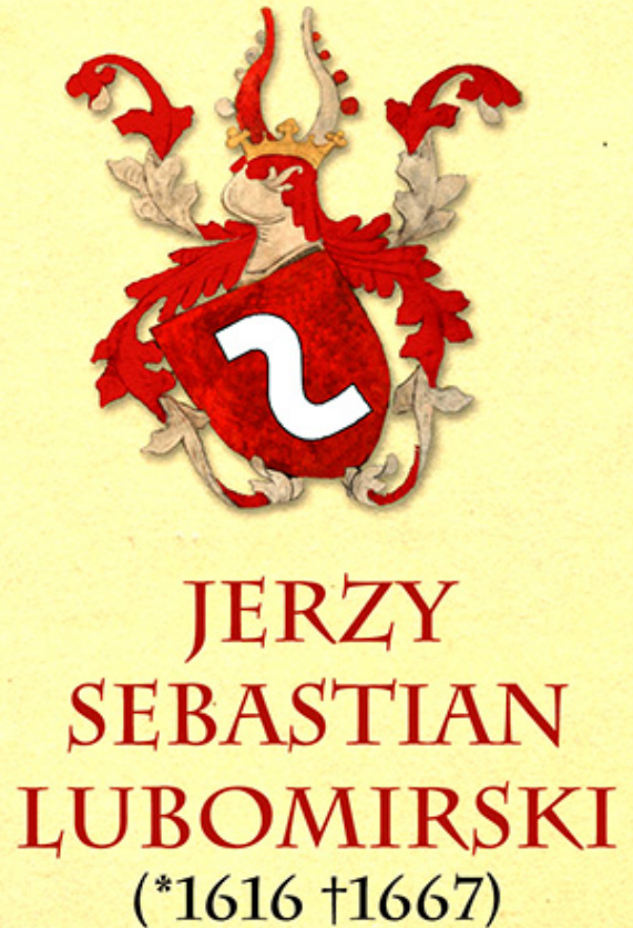
JERZY SEBASTIAN LUBOMIRSKI (*1616 †1667)