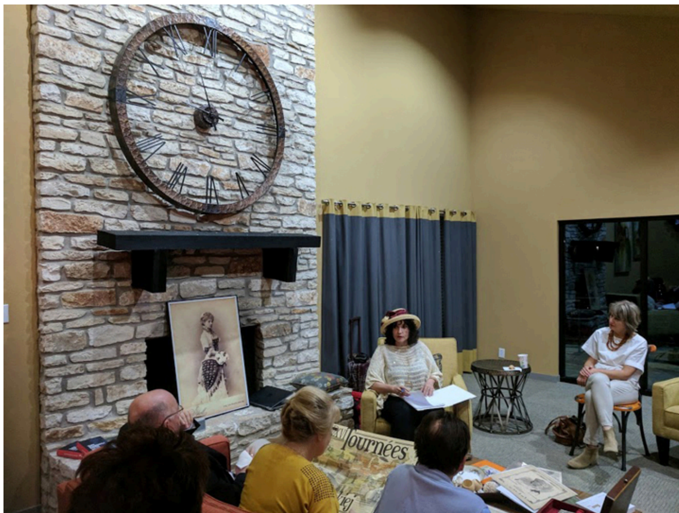
Wieczór na temat Heleny Modrzejewskiej, 19 listopada 2017 roku w Austin