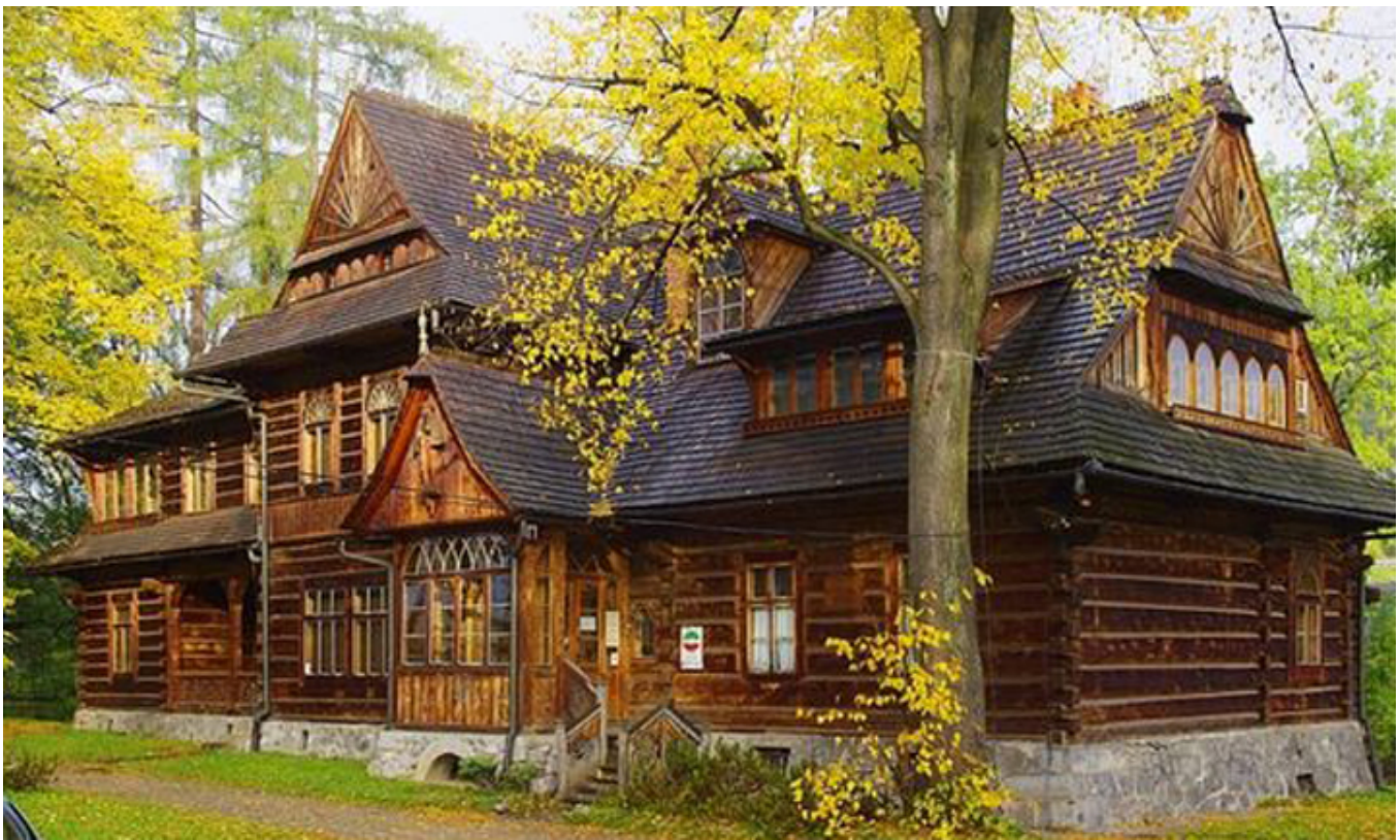
Muzeum Stylu Zakopiańskiego, willa „Koliba”, fot pinterest.

Zdawał sobie sprawę z ważnej roli piśmiennictwa narodowego w propagowaniu idei walki o wolność. Uważał, że teksty literackie oraz pocztówki z obrazami o tematyce patriotycznej winny być przetrzucane samolotami na linię frontu. Rozumiał siłę oddziaływania legendy literackiej i artystycznej współczesnych bohaterów narodowych na umysły rodaków. Legenda taka miewa – według niego – siłę większą, niż żelazny oręż, Cieszył się, że ogłoszone jego listy do siostry na coś się przydadają w procesie propagowania czynu legionowego. Żałował, że zakopiański Sabała już nie żyje. On swoim talentem gawędziarskim wzmocnił by legendę Piłsudskiego.