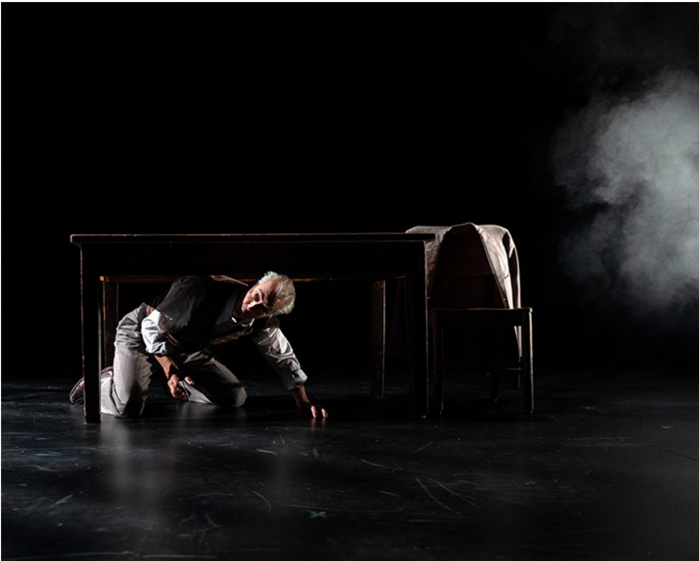
[REDACTED] jako Jan Karski w przedstawieniu [REDACTED] [REDACTED]

[REDACTED] [REDACTED] [REDACTED] [REDACTED] [REDACTED] [REDACTED] [REDACTED] [REDACTED]