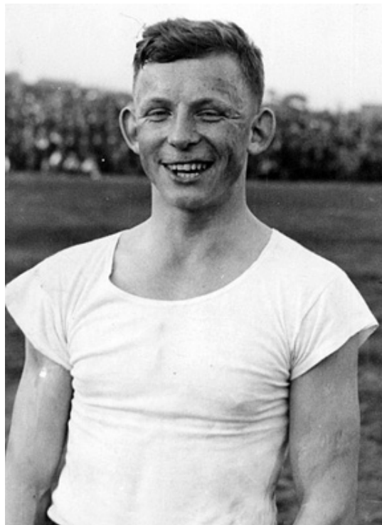
Ernest Wilimowski, 1936 r.

Mecz, który 4 czerwca 1938 roku rozegrał się pomiędzy Polską i Brazylią, a ściślej – transmisja z tego meczu – są punktem kulminacyjnym powieści. Szczególnie zaś istotne jest to, co rozgrywa się w dwudziestej trzeciej minucie, kiedy to Ernest Wilimowski toczy walkę z potężnym Brazylijczykiem Hérculesem – niczym Dawid i