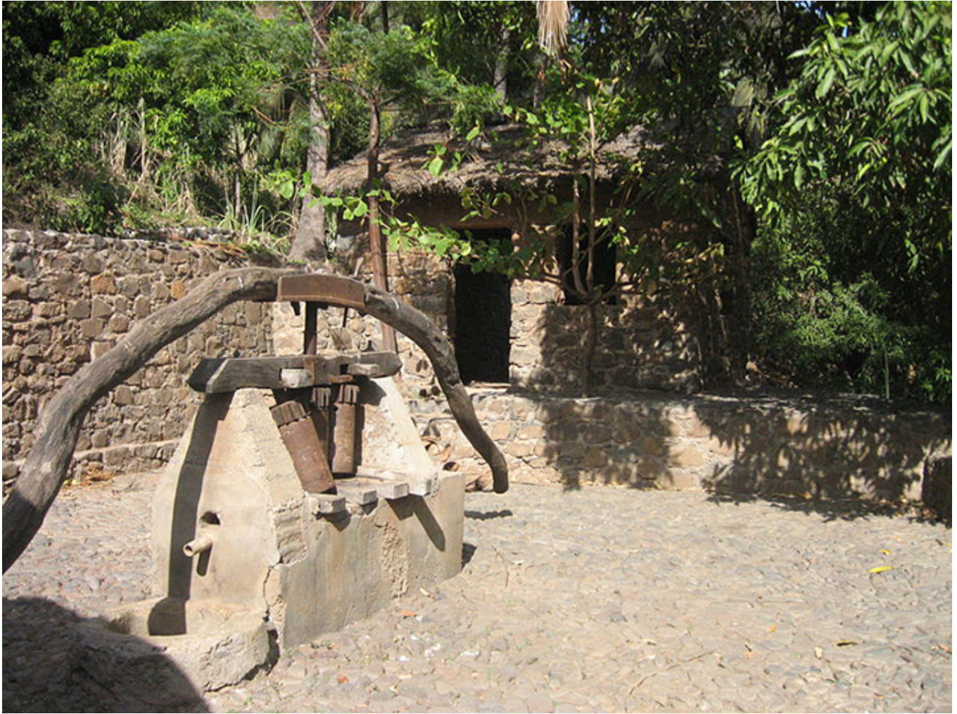
Cidade Velha. Kierat do wytlaczania soku z trzciny cukrowej.