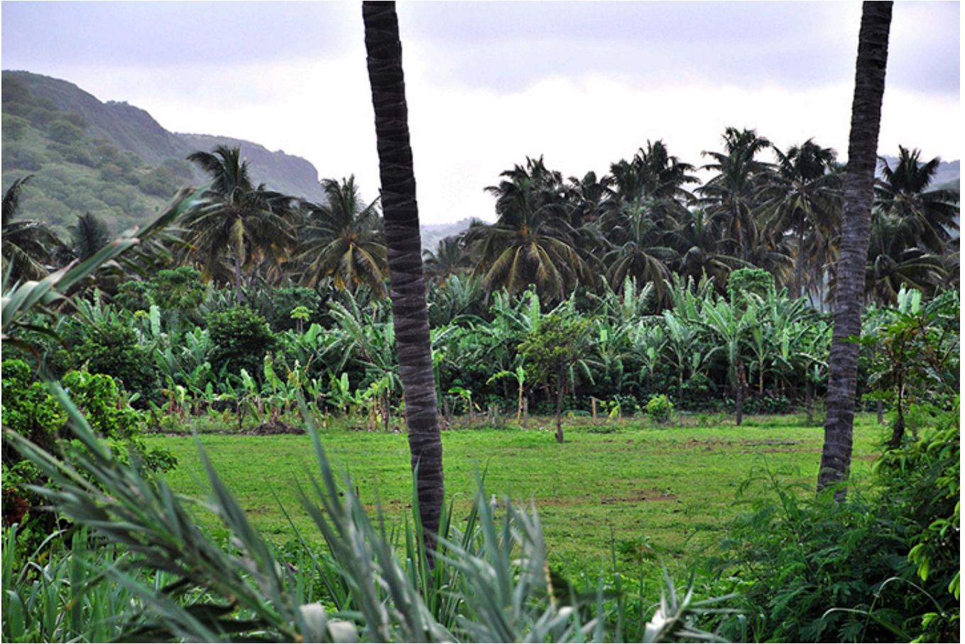
Krajobraz Wyspy Santiago.