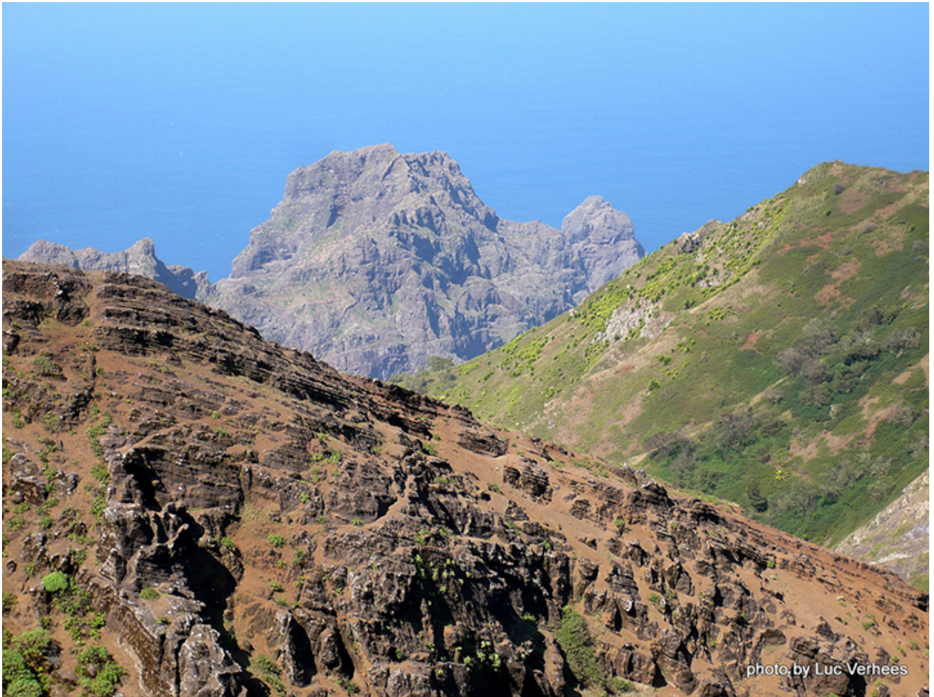
Wyspa św. Mikołaja.