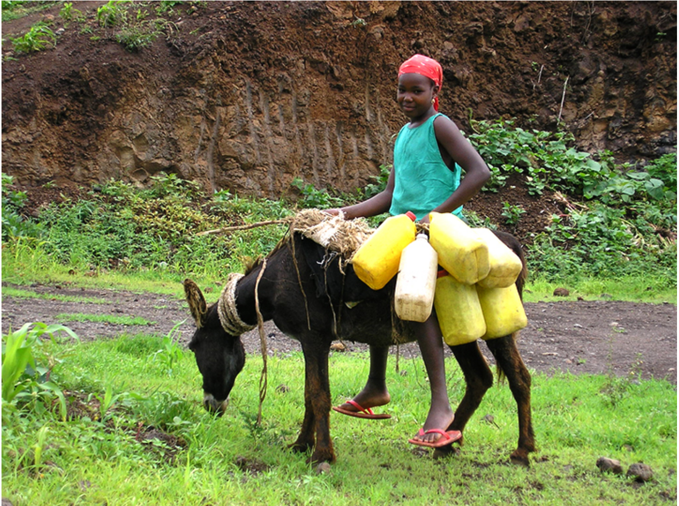
Na wyspie Santiago.