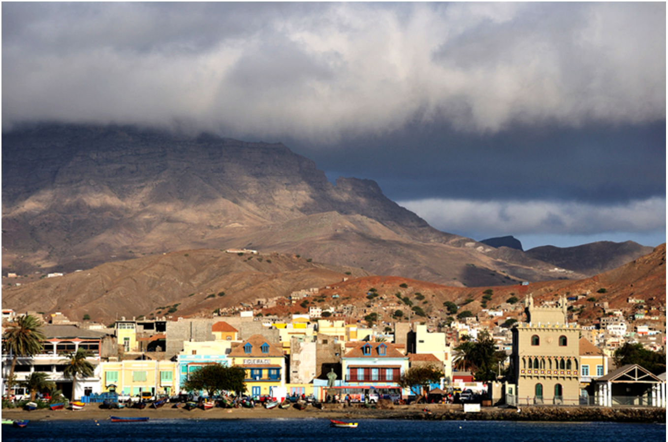
Mindeló od strony oceanu. Po prawej, kopia lizbońskiej Wieży Betlejemskiej.

Szedłem brzegiem oceanu. Jaskrawe słońce zalewało uśmiechające się do mnie wdzięczne kolorowe kamieniczki. Zapytałem policjanta o kościół, ale zanim tam poszedłem, zgłodniały, zasiadłem do stolika wprost na ulicy obok małej pizzerii. W dzikim tempie pożarłem dwa kawałki smacznej pizzy popijając piwem. Miły chłopiec z przykościelnej kancelarii zaprowadził mnie do hoteliku o nazwie Residencial Novo Horizonte (Rezydencja Nowe Horyzonty – sic!!!), gdzie po kąpieli runąłem do łóżka na całe 12 godzin. Spałem jak kamień od 20-tej do 8-ej rano następnego dnia.