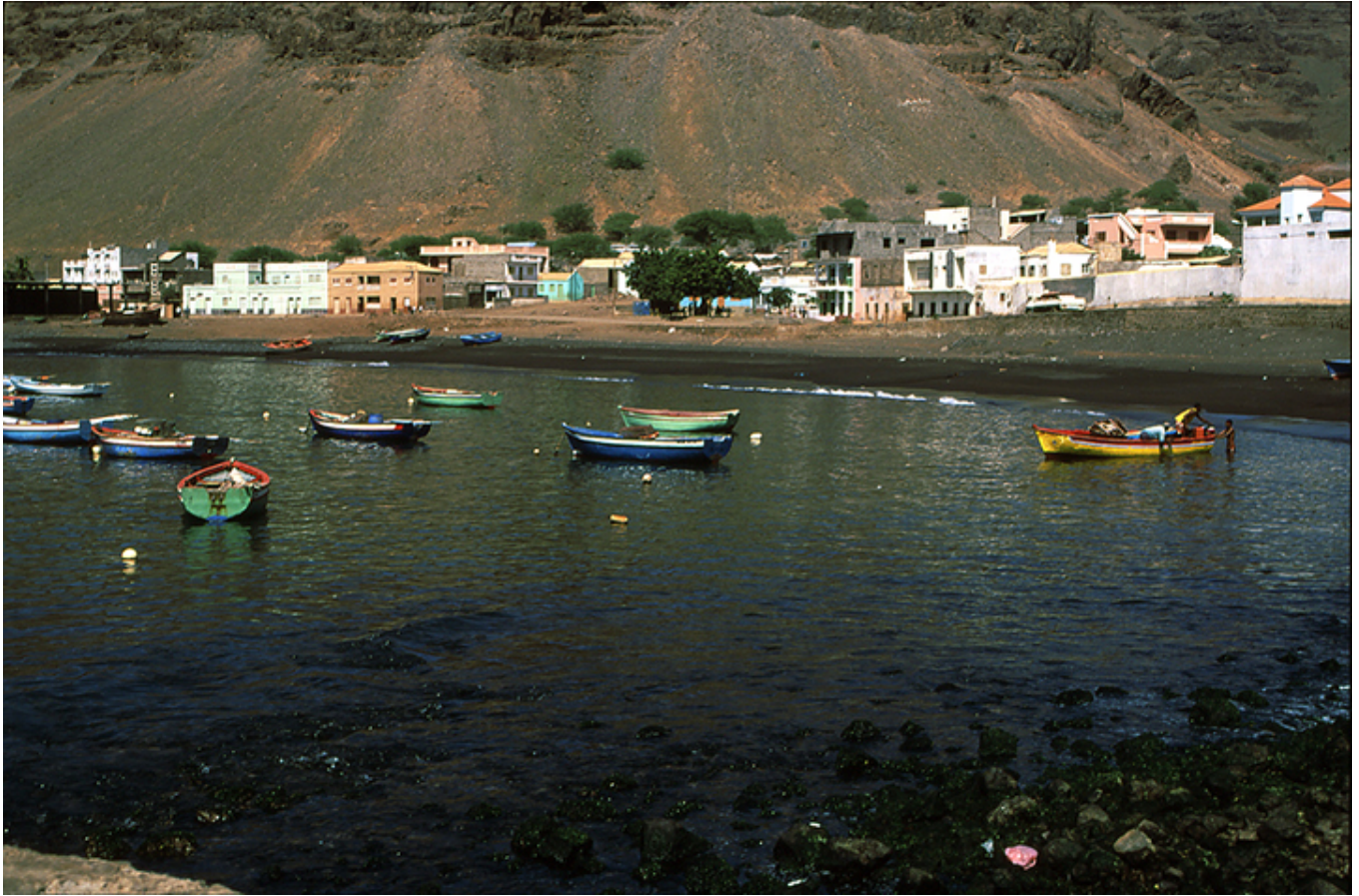
Wyspa św. Mikołaja. Port Tarrafal.