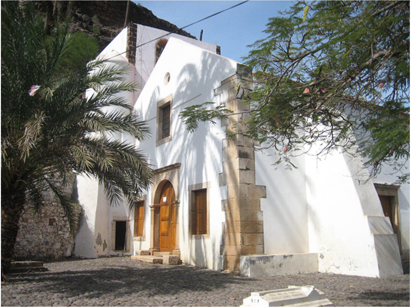
Kościół Matki Boskiej Różańcowej w Cidade Velha na Wyspie Santiago.