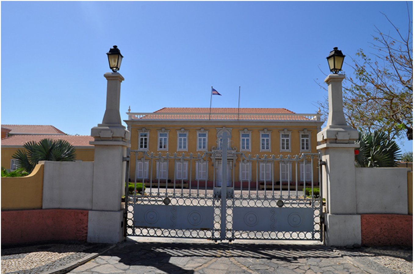
Pałac Prezydencki, Praia - Plateau na Wyspie Santiago.