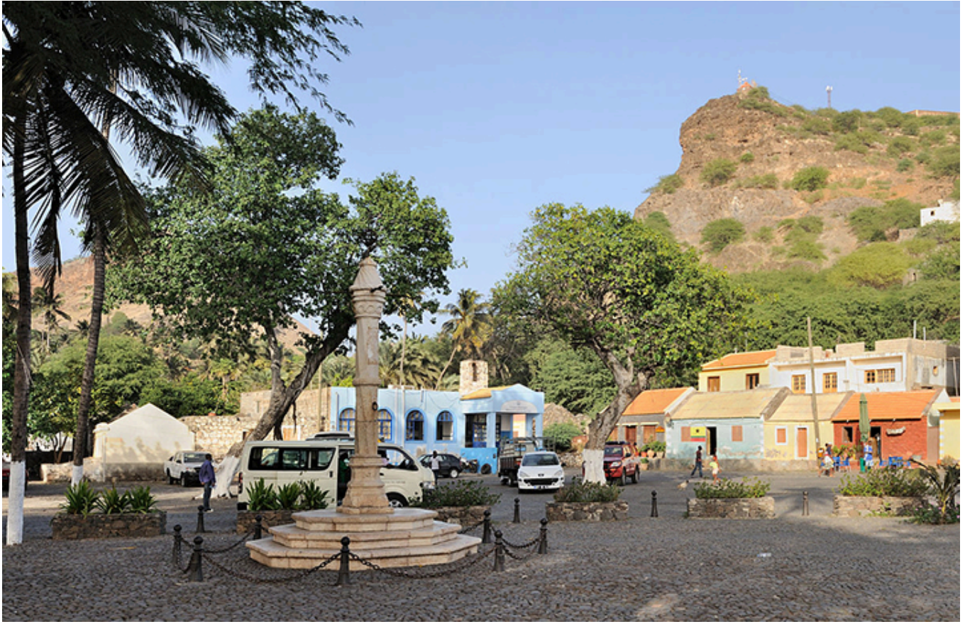
Cidade Velha. Plac z Pręgiem.