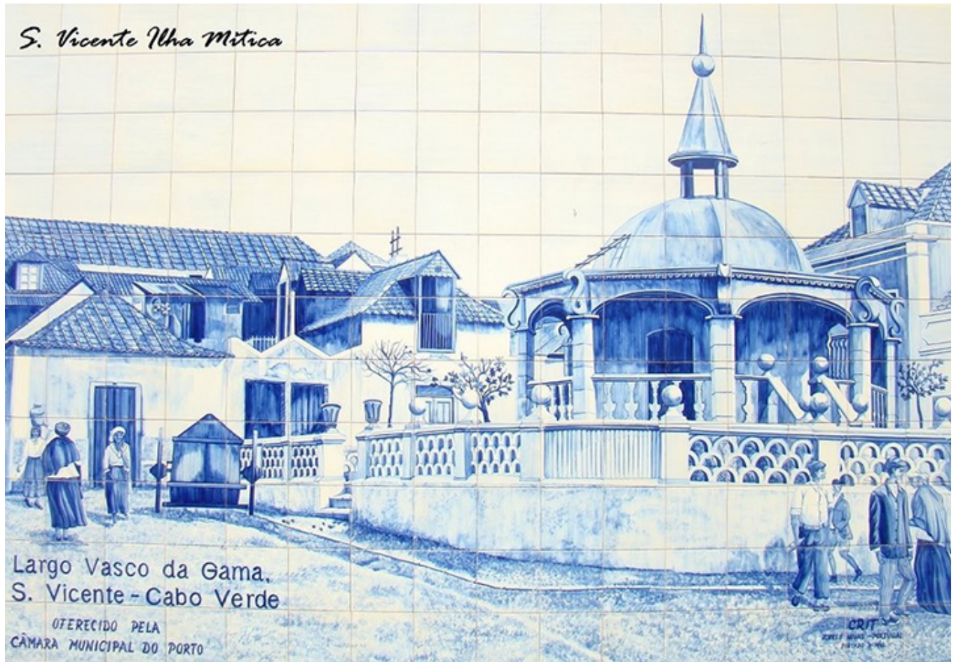
Plac Vasco da Gamy na kafelkach.

Mikrobusy do opiewanego przez Cesarię małego, ukrytego za górami portu rybackiego Salamansa odchodzą z Placu Gwiazdy ( Praça da Estrela ), aliści trzeba czekać, aż mikrobus wypełni się całkowicie pasażerami. Na to nie mam ochoty. Targowisko na nabrzeżu, potem kopia lizbońskiej wieży Belém i w trakcie drobiazgowego oglądania ufundowanych przez miasto Porto w Portugalii kafelków z widokami dawnego Mindelo na ścianach straganów na Placu Gwiazdy, odjeżdża mój mikrobus, skręcając w prawo, ku rogiom miasta. Taksówką na koniec miasta i autostop. Zatrzymuje się stary Ford, a w nim dwóch panów udających się po zioła do doliny Monte Verde (najwyższy szczyt