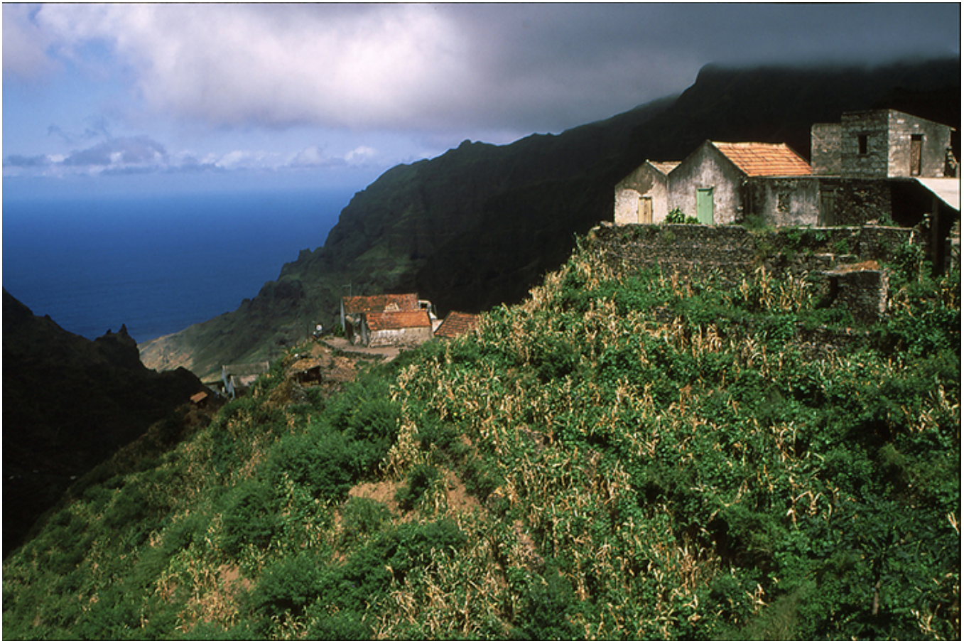
Góry na Wyspie św. Mikołaja.

Około 10-tej rano statek przybił do nabrzeża portu Tarrafal na Wyspie Św. Mikołaja . Podczas dwugodzinnego postoju do jego przestronnych ładowni wjeżdżały wielkie TIR-y obciążone workami ryżu i innych towarów. Słońce piekło nieźle. Obserwowałem z pokładu wyniosłe góry: żadnej roślinności, kamienna pustynia, a wszystko w kolorze ciemnej ochry, typowy powulkaniczny krajobraz. Na najbliższej plaży czarny piach leczniczy z domieszką tytanu. W planie jest założenie tu uzdrowiska dla chorych na reumatyzm. Tymczasem czekoladowi pasażerowie statku zainteresowali się białym, przy nich jakby obsypanym mąką starszym Luksemburczykiem, a teraz przyszła