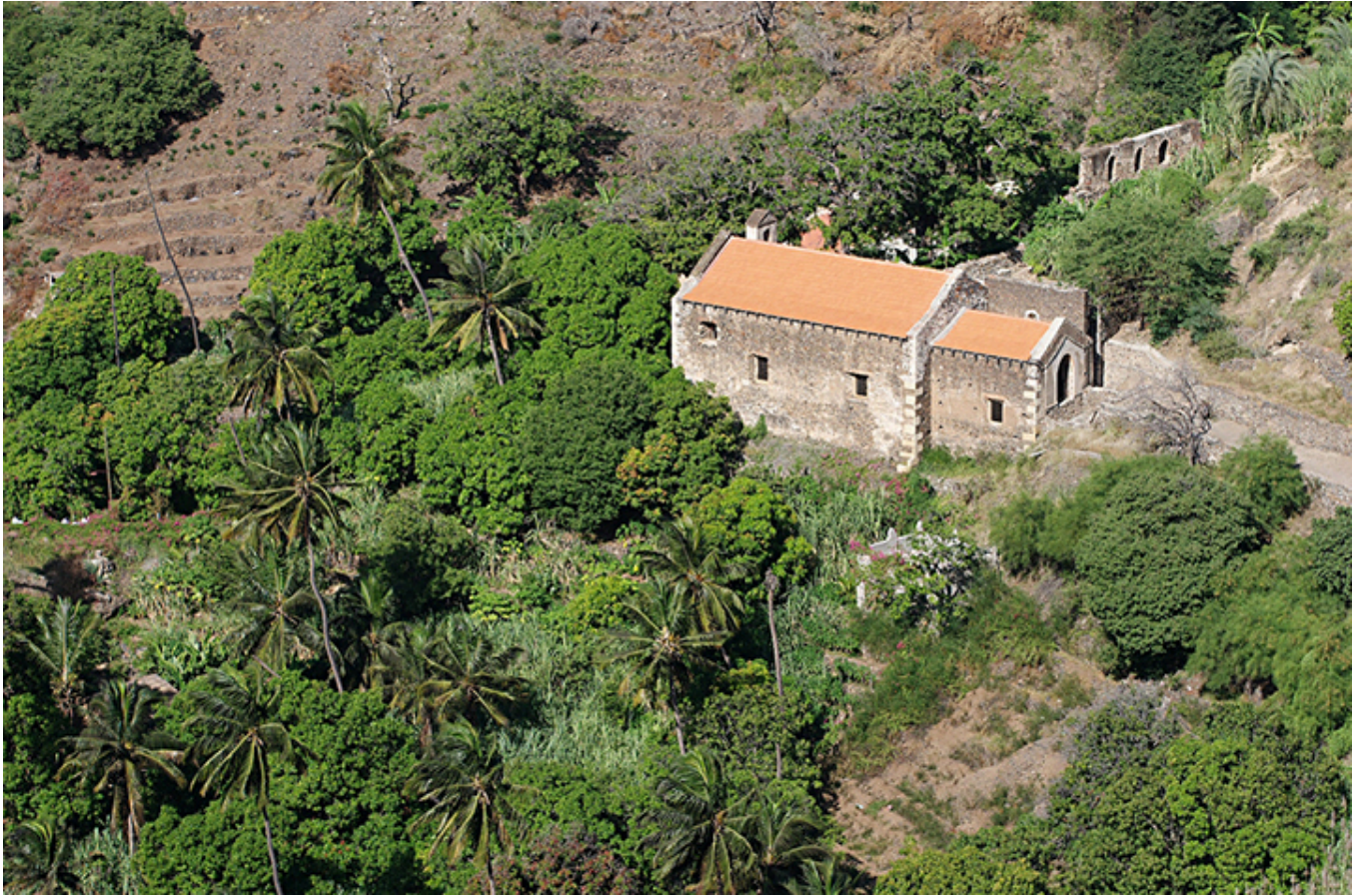
Cidade Velha. Klasztor św. Franciszka.