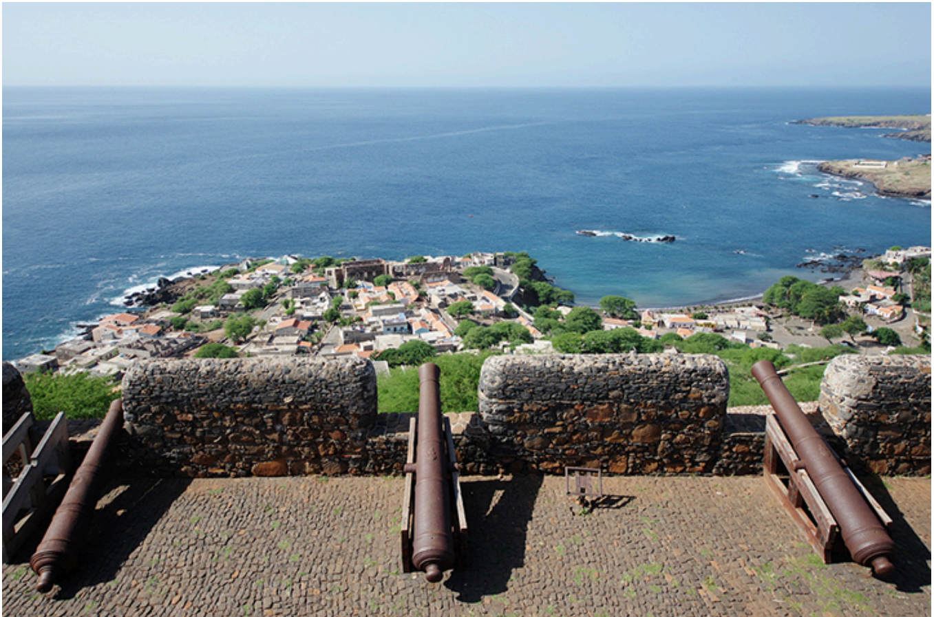
Cidade Velha. Królewska Forteca św. Filipa.

Największą atrakcją miasteczka są ruiny katedry w jego centrum. Sterczą tam wyniosłe fragmenty pobielonych wewnątrz ścian, rzekłbyś, ich nagie kikuty. Nie widać jednak żadnych zabytkowych rzeźb czy malowideł. Oto pamiątka po zniszczeniach dokonanych w 1712 roku przez francuskiego korsarza Cassarda. Wcześniej kilkakrotnie napadał na miasto osławiony Francis Drake. Jedyna ulica opada stromo w stronę centralnego placu, gdzie dumnie wznosi się w cieniu palm kokosowych stary portugalski pręgierz. Dno rzeki zagłębia się w dolinę, gdzie w zieleni schowane oba kościoły. Po drodze, w zakątku otoczonym kamiennym murem, archaiczny, ale wciąż używany trapiche , czyli rodzaj kieratu do wyciskania soku z