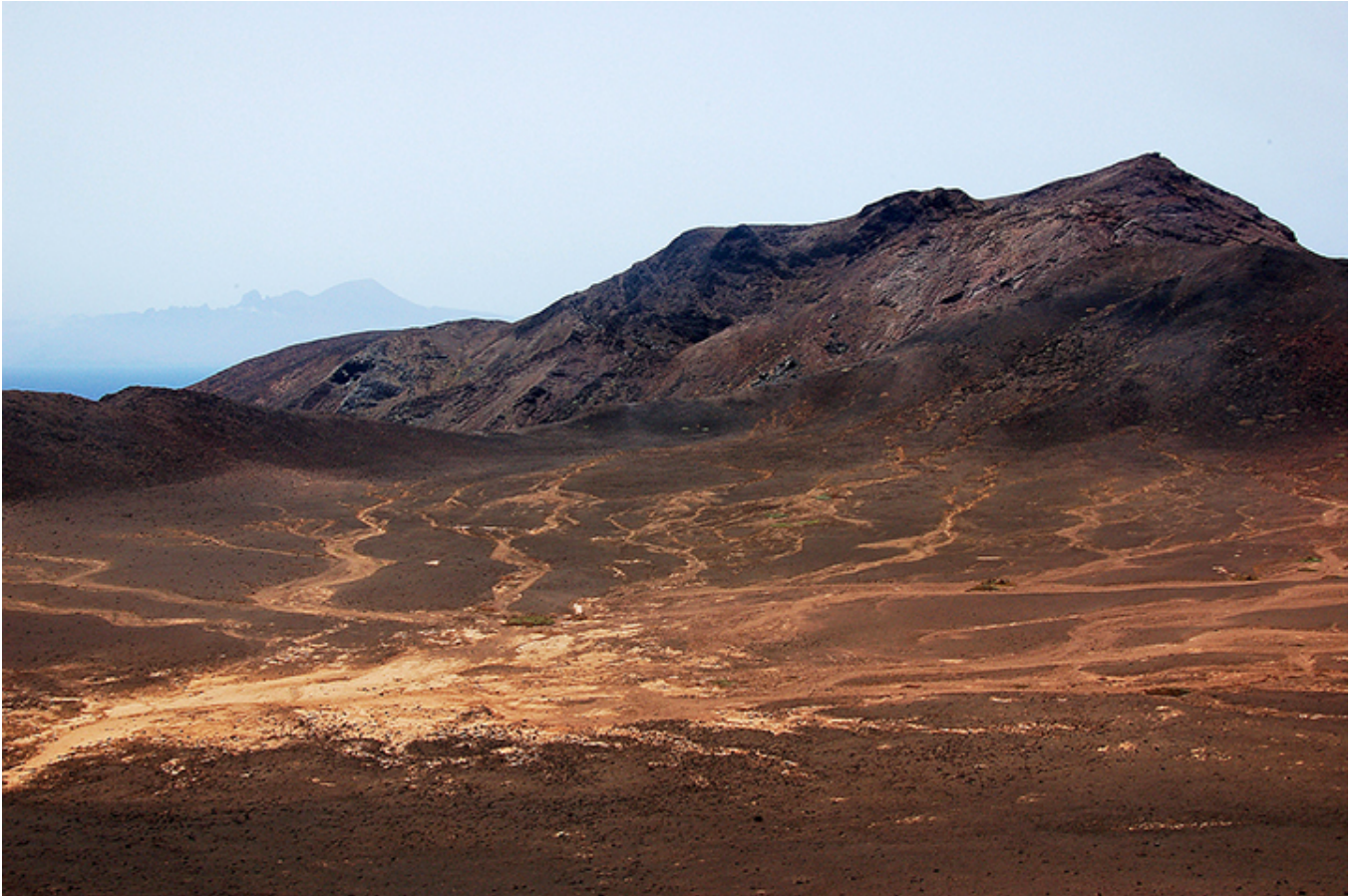
Ilhéu Raso, czyli Wysepka Płaska.