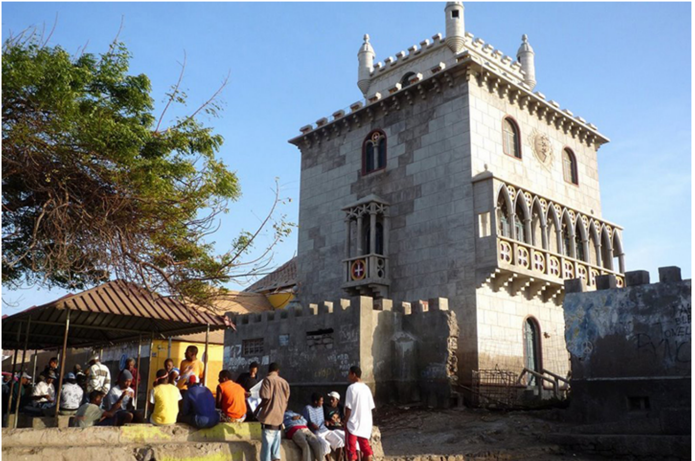
Mindelo. Kopia Wieży Betlejemskiej z Lizbony.