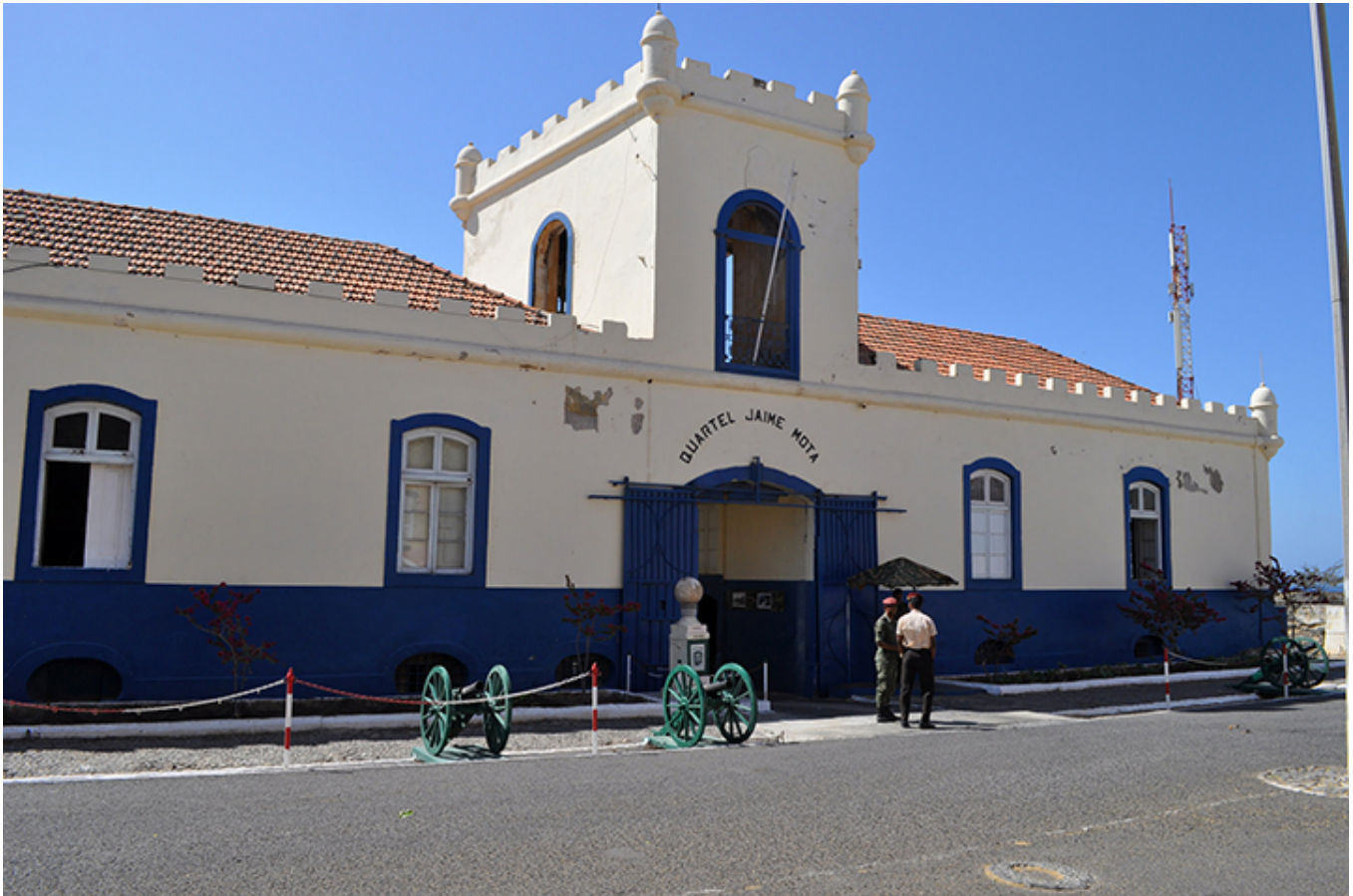
Koszary im. Jaime Mota. Plateau - Praia.