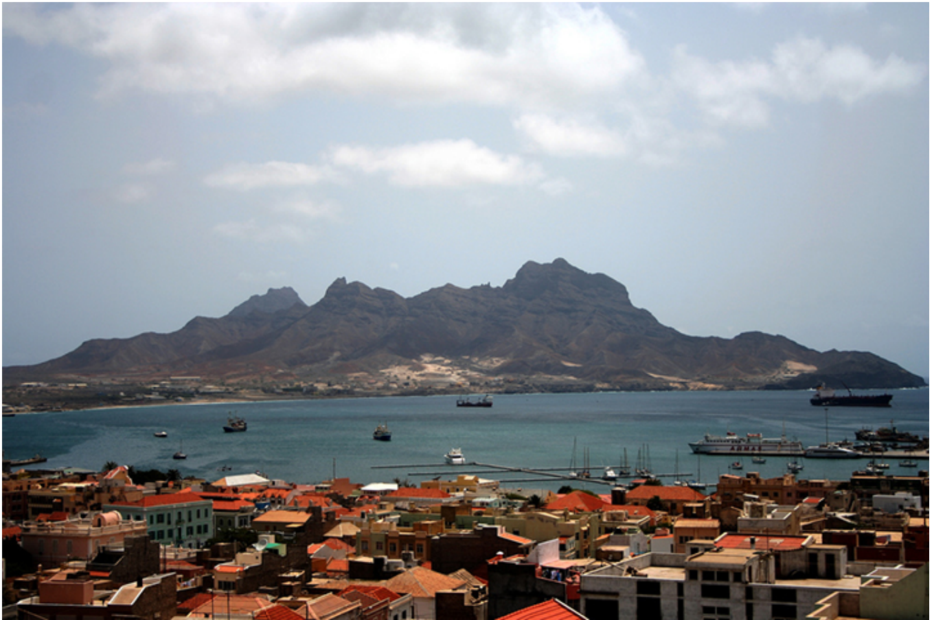
Mindelo. Góra zwana Twarzą (Montanha Cara).