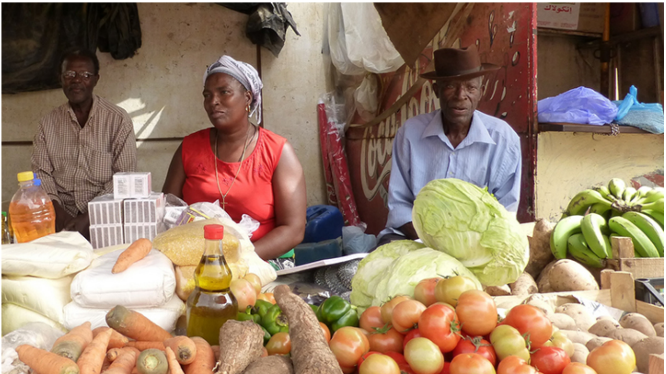
Targowisko w dzielnicy Plateau w mieście Praia.

Stare centrum Prai , owo Plateau lub Platô to właściwie jedno wielkie targowisko: wszędzie pełno kolorowo ubranych przekupek