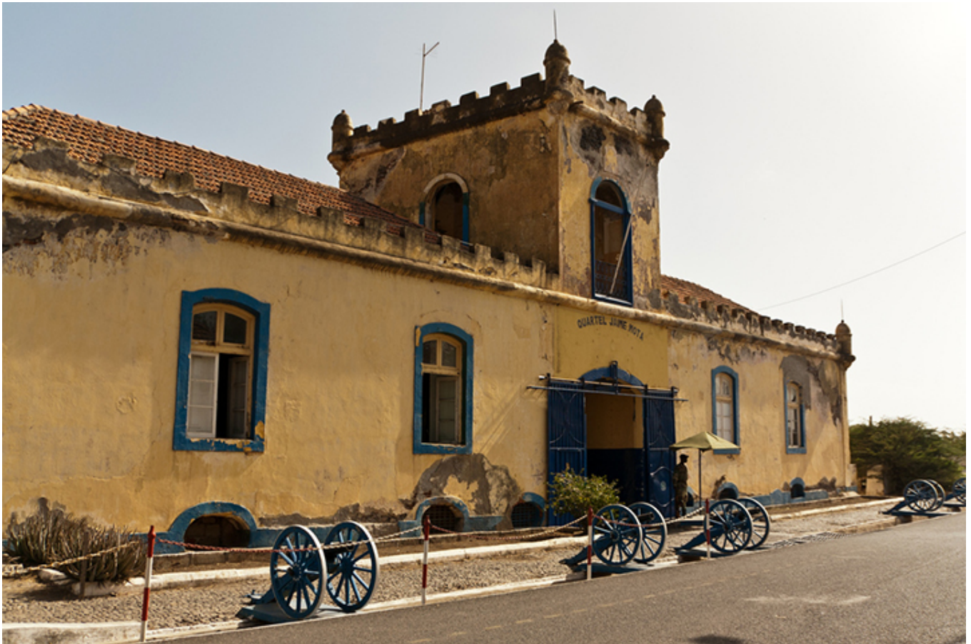
Plateau. Koszary im. Jaime Mota.