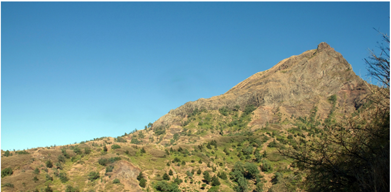
Santiago. Pico d'Antónia (Szczyt Antoniny 1392 m).