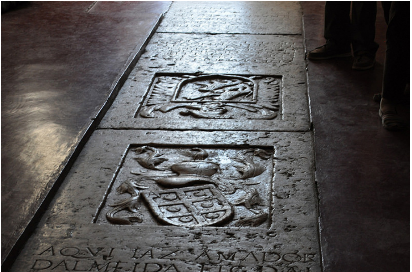
Płyty w posadzce kościoła Matki Boskiej Różańcowej. Cidade Velha.