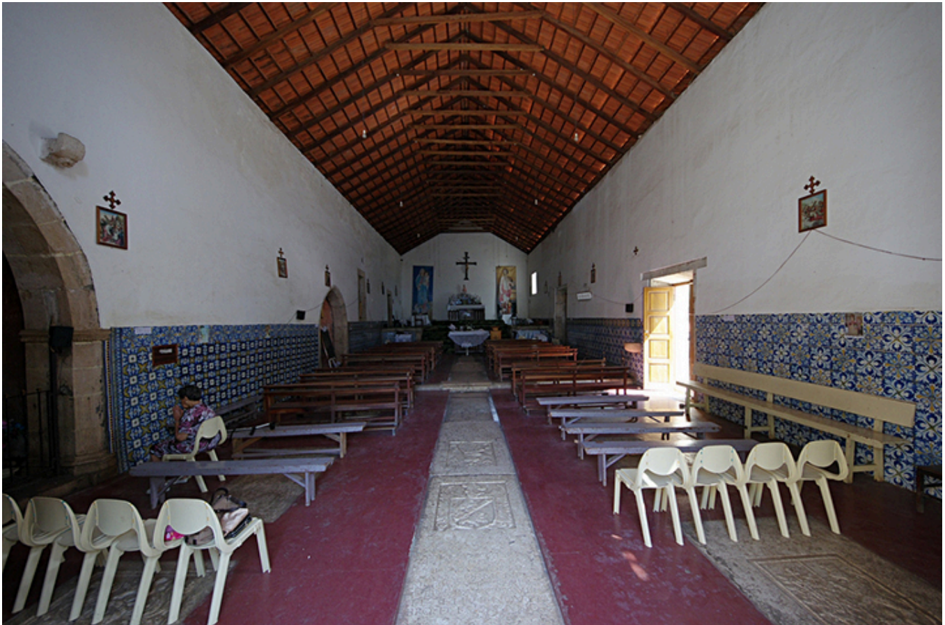
Cidade Velha. Wnętrze klasztoru Matki Boskiej Różańcowej.