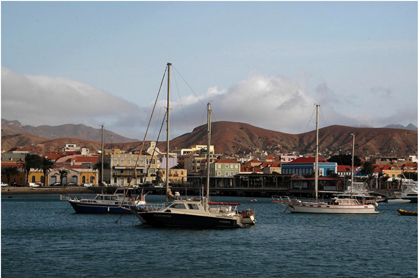
Mindelo. Okolice portu.