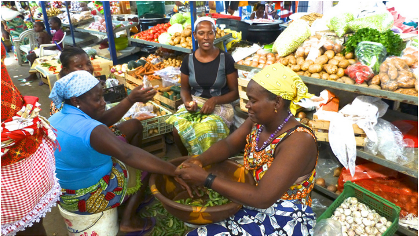
Stolica Wysp, Praia. Plateau. Targowisko.