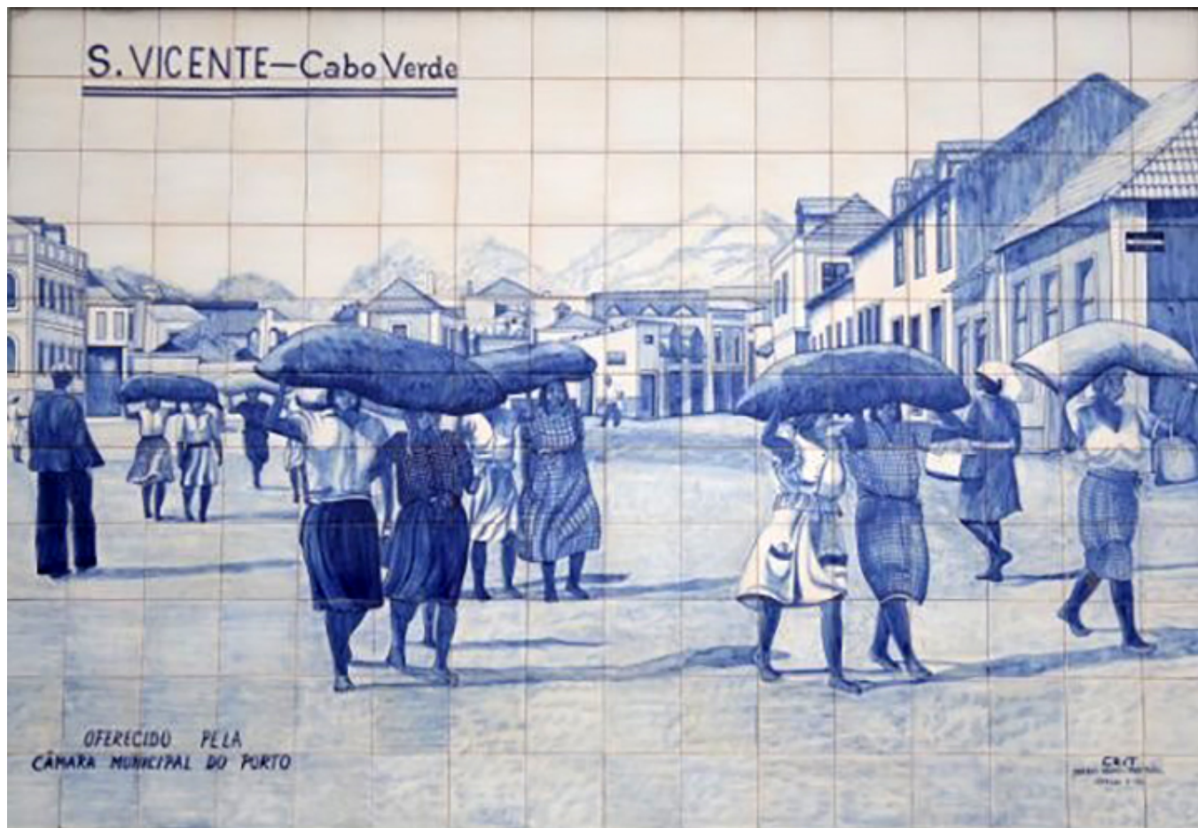
Kafelki z widokami dawnego Mindelo.