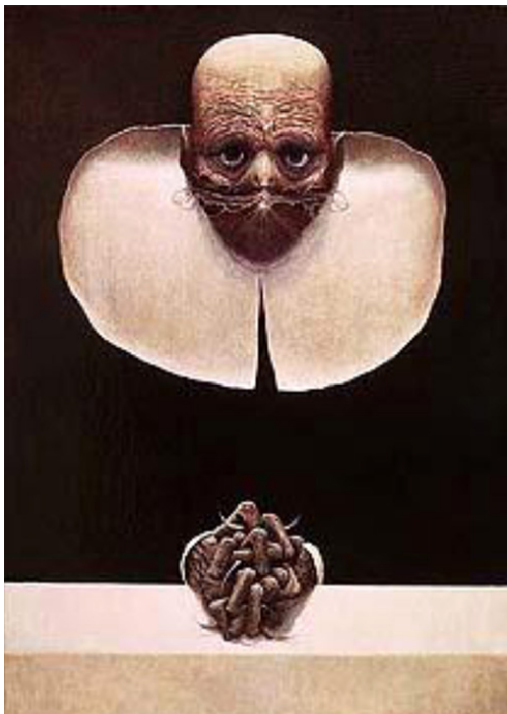
Zdzisław Beksiński (1929-2005), Bez tytułu, 1970, olej na płycie pilśniowej, 70 x 61 cm. Kolekcja prywatna.