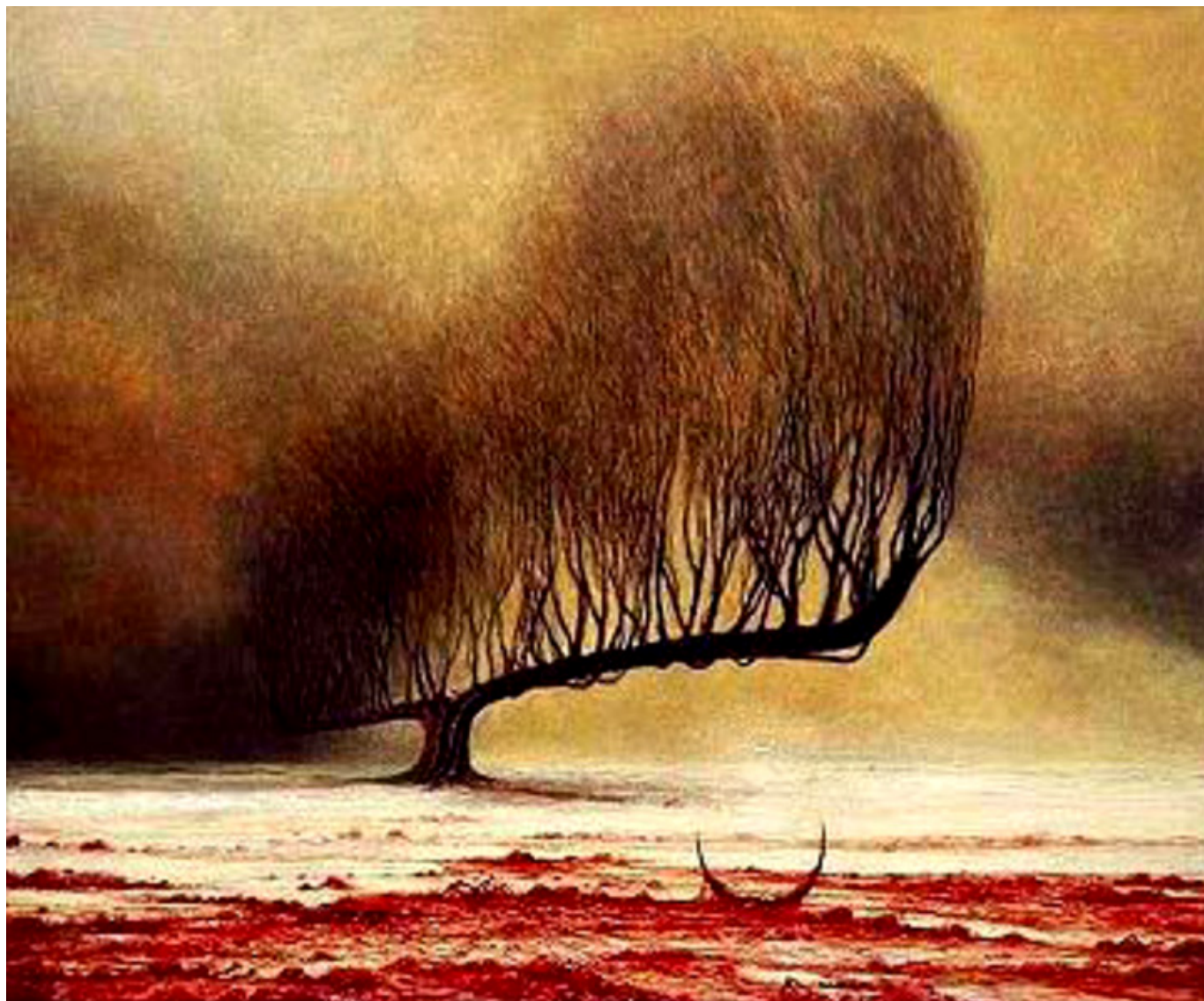
Zdzisław Beksiński (1929-2005), Bez tytułu, 1979, olej na płycie pilśniowej, 73 x 87 cm. Kolekcja prywatna.