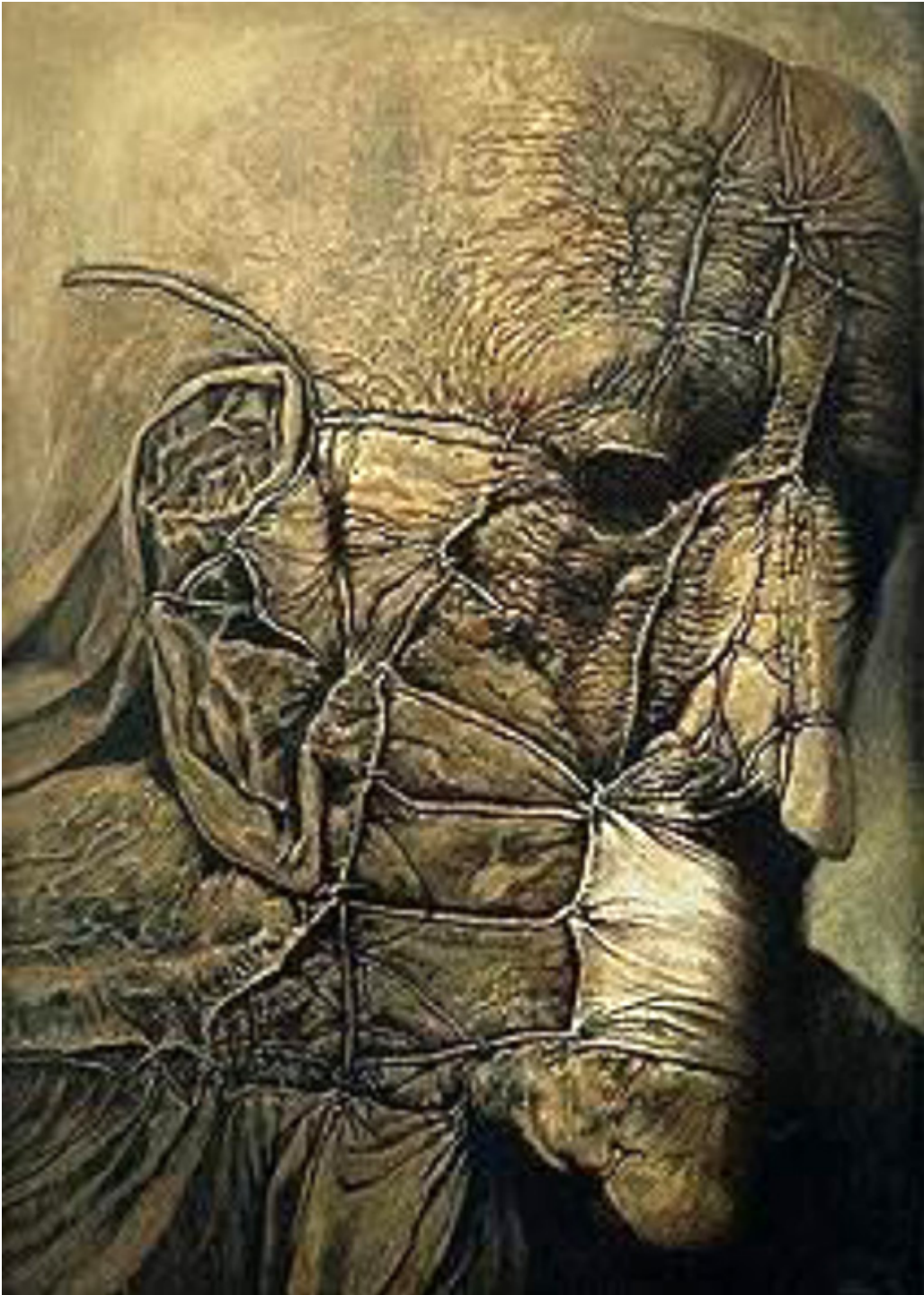
Zdzisław Beksiński (1929-2005), Bez tytułu, 1968, olej na płycie pilśniowej, 84 x 60 cm. Kolekcja prywatna.