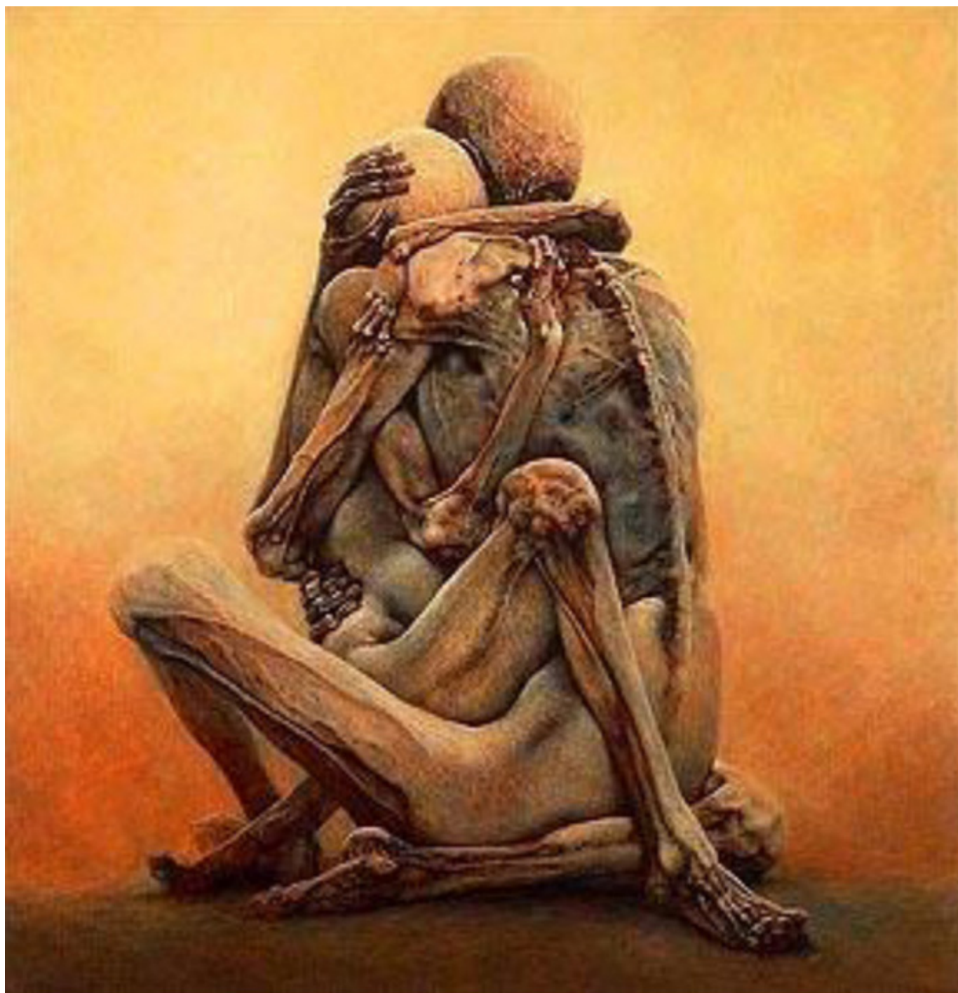
Zdzisław Beksiński (1929-2005), Bez tytułu , 1984, olej i akryl na płycie pilśniowej, 101 x 98,5 cm. Kolekcja prywatna.