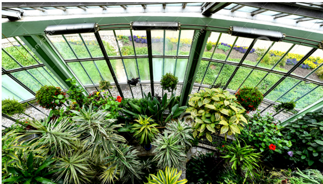
Ogród Zimowy przy pałacu Tyszkiewiczów w Kretyndze.

Olbrzymi „baumkuchen” miał metr wysokości. Do tego dwanaście ogromnych mazurków, pomarańczowy, kawowy, czekoladowy, daktyłowy, migdałowy, bakaliowy, królewski itd. Ponieważ kucharze w Kretyndze głównie pochodzili z kresów, więc wyspecjalizowani byli w świątecznych babkach. Na stole musiało być co najmniej dziesięć gatunków: chlebowa, petynetowa, kawowa, szafranowa... Kucharze coraz to donosili świeże potrawy, uzupełniali znikające. Przez pierwszych kilka dni jedzenie może i było atrakcją, bo takiej obfitości różnych specjałów na co dzień nie jadano, ale po dwóch tygodniach to i najbardziej wykwintna potrawa, podana w nadmiarze mogła się przejeść.