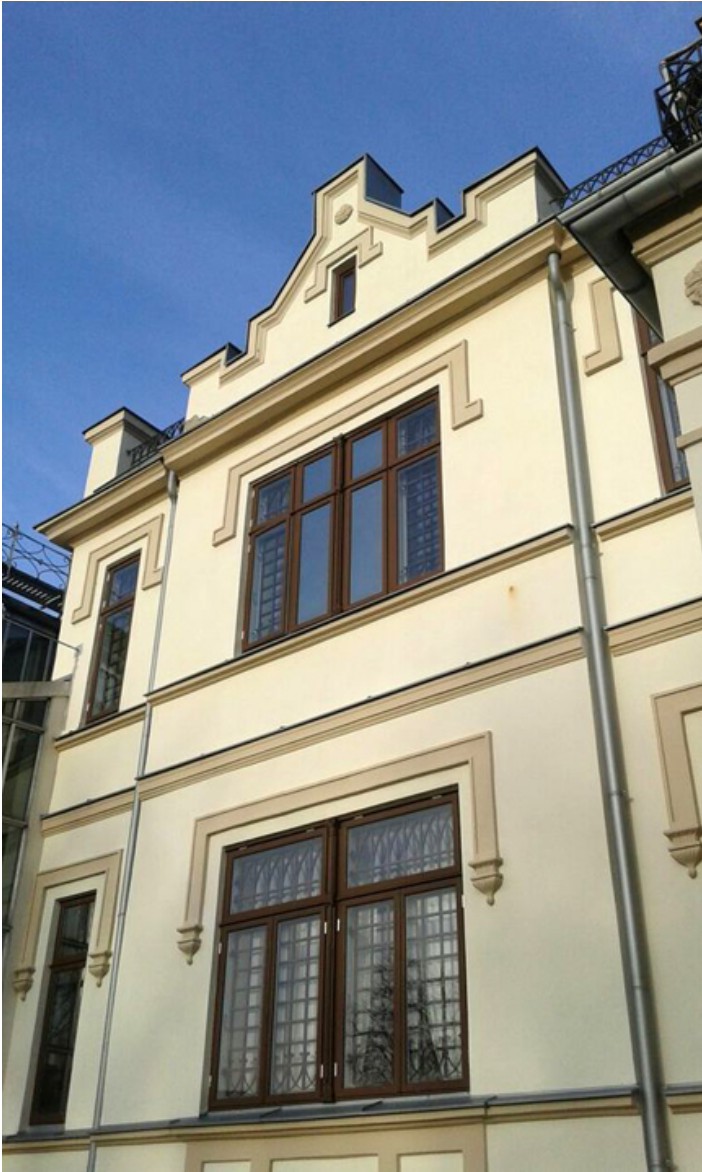
Pałac Tyszkiewiczów w Kretyndze.