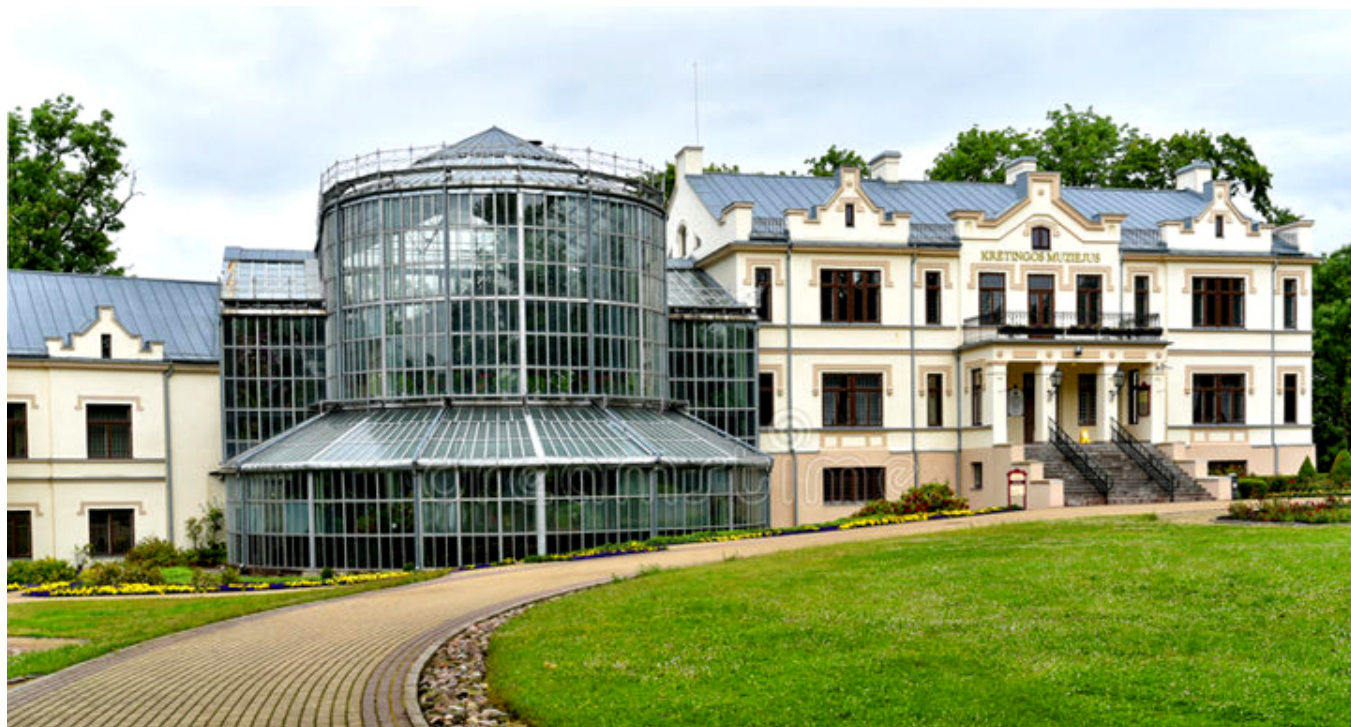
Pałac Tyszkiewiczów w Kretyndze. W środku, oszklony Ogród Zimowy z egzotycznymi roślinami.