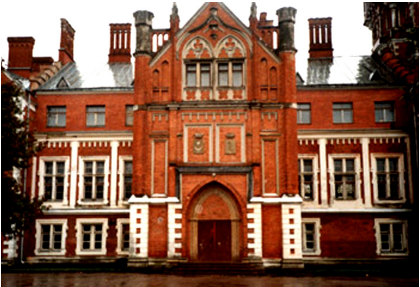
Pałac w Landwarowie od frontu, fot. Joanna Sokołowska-Gwizdka.

Tyszkiewiczowie zamieszkali najpierw w Landwarowie. Ze względu na bliskość węzła kolejowego rezydencja oprócz „zwykłych” gości, rodziny i sąsiadów, przeżywała istne naloty krewnych, kuzynów i dalszych znajomych. Pociągi jeździły wówczas rzadko, czasami i tydzień trzeba było czekać na przesiadkę. Jechano więc do Tyszkiewiczów, gdzie czas szybko płynął i z tygodnia robił się nie wiadomo kiedy miesiąc. Nic więc dziwnego, że po 10 latach takiego życia hr Zofia, mimo staropolskiej gościnności, miała już serdecznie dosyć tych nieustających i nie kończących się wizyt. Postanowiono przenieść swoją siedzibę, jak najdalej od węzła kolejowego. Fantazja hr