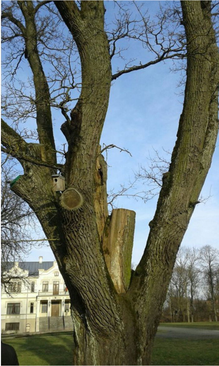
Pałac Tyszkiewiczów w Kretyndze.