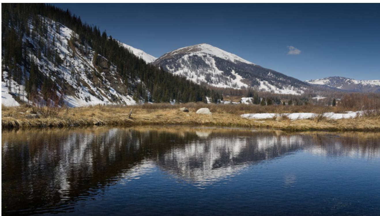
Góry Ałtaj w Kazachstanie