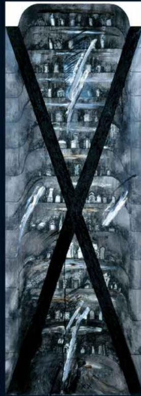
6 - 8. From the cycle "Windows of the Twentieth Century", Oil on canvas, 1987 9. From the "Pulsar" cycle, Oil on canvas, 1988 10. Mandala , An interpretation, Oil on canvas, 1978