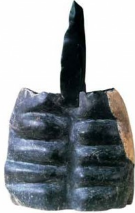
3. Terna , Spino Anale, 2000 4. Warrior , Real, 1999 5. Mongolian Symbols of Lamas Gri-Gag , Julian Ish