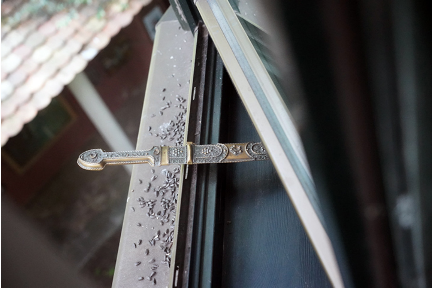
Przedmioty z historią, ważne dla reżysera