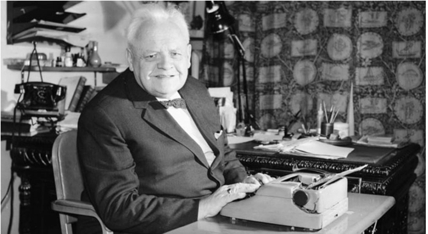
Melchior Wańkowicz przy pracy, Warszawa, 1963 r.. fot. PAP/CAF-Stanisław Dąbrowiecki